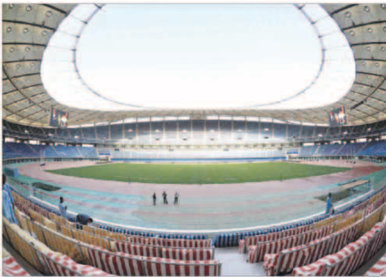
استاد جابر الدولي

أعلنت اللجنة المؤقتة المكلفة بإدارة شؤون اتحاد كرة القدم أن استاد جابر الدولي سيستضيف لقاء السوبر الذي سيجمع القادسية (بطل دوري فيفا) والكويت (بطل كأس الأمير)، وذلك في يوم 23 من شهر سبتمبر المقبل. يذكر أن كأس السوبر كان مقرراً إقامته في التاسع من شهر سبتمبر المقبل، ليتم تأجيله مرتين، الأولى في 21 من الشهر ذاته، والثانية في 23 منه. وتتفق اللجنة الانتقالية كتاباً من قبل الهيئة العامة للرياضة بالموافقة على إقامة السوبر على استاد جابر الدولي، والذي يقع تحت إشراف الهيئة. يذكر أن استاد جابر الدولي تم افتتاحه رسمياً في شهر يناير الماضي بحضور أمير الكويت الشيخ صباح الأحمد الصباح وولي عهده الأمين الشيخ نواف الأحمد الجابر الصباح ولطف من الشخصيات رفيعة المستوى. وشهد الافتتاح إقامة حفل كبير تخلله عروضاً فنية، واختتم بمواجهة نجوم منتخب الكويت مع نجوم منتخب العالم، وعقب الافتتاح استضاف الاستاد نهائي كأس ولي العهد بين السلطنة والكويت، ثم نهائي كأس الأمير بين الكويت والسعودية. من جانب آخر بات قيد اللاعبين للمحترفين الجدد في سجلات الاتحاد الكويتي لكرة القدم أزمة تُسوّق عدداً من الأندية دون استئذان، بعد صدور قرار الهيئة العامة للرياضة بحل مجلس إدارة الاتحاد السابق، ومن ثم رفض الاتحاد الدولي للعبة «الفيفا» التعامل مع اللجنة المؤقتة المكلفة بإدارة شؤون الاتحاد.