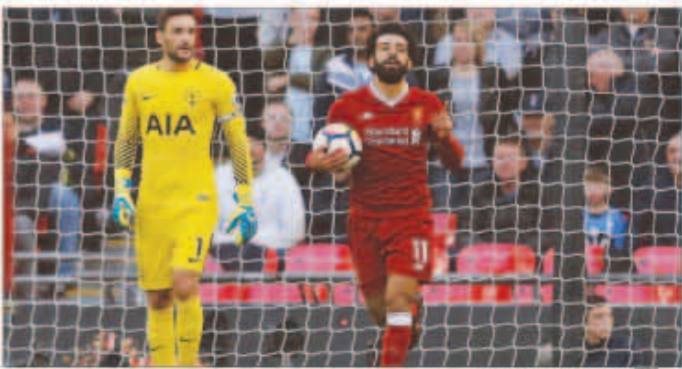
صلاح يتحدى فريقه القديم

بما في ذلك عشر مباريات في الدوري الممتاز. ويحل سبتي ضيفا على هيدرسفيلد تاون يوم الأحد وبحلول ذلك الوقت ربما يكون مانشستر يونايتد نجح في تقليص الفارق إلى 5 نقاط لو فاز على ضيفه برايتون أند هوف البيون. ويتعد سبتي بـ 3 مباريات عن سلسلة الانتصارات القياسية للدوري التي حققها تشيلسي، الموسم الماضي، وأرسنال. ويلعب توتنهام صاحب المركز الرابع، الذي تقدم عليه تشيلسي في الأسبوع الماضي بعد هزيمته أمام أرسنال، ضد وست بروميتش البيون المتعثر الذي أقال مدربه توني بوليس هذا الأسبوع.