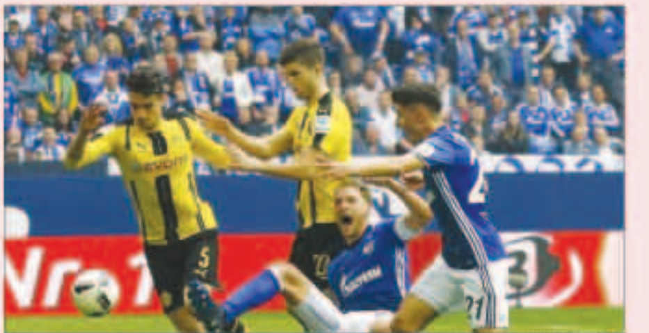
شالكة ودورتموند في مواجهة ذرية

تقاط كاملة عن ملاحقه شالكة ولايزج، على سجل انتصاراته بنسبة 100% منذ عودة بوب هاينكس لتدريب الفريق بتفخيه بصعوبة على اندرلخت البلجيكي في منافسات دوري أبطال أوروبا. وقال هاينكس «ليس هذا ما نهدف إليه، لقد فزنا 2 / 1 ولكننا لم نحط أنفسنا بالمجد». وكان جلادباخ ندا لبايرن ميونخ في إسام مجددهم في السبعينيات ولكن الفريق الجديد الذي يديره ديتير هيكينج ففز للمركز الرابع وسيتمتد بفرصة في تحقيق نتيجة إيجابية. وقال فينشينز جريفو للموقع الرسمي لناديه على الإنترنت «نحتاج لتقديم أداء كبير أمامهم في تحقيق نتيجة إيجابية». وقال فينشينز جريفو للموقع الرسمي لناديه على الإنترنت «نحتاج لتقديم أداء كبير أمامهم في تحقيق نتيجة إيجابية». وقال فينشينز جريفو للموقع الرسمي لناديه على الإنترنت «نحتاج لتقديم أداء كبير أمامهم في تحقيق نتيجة إيجابية».