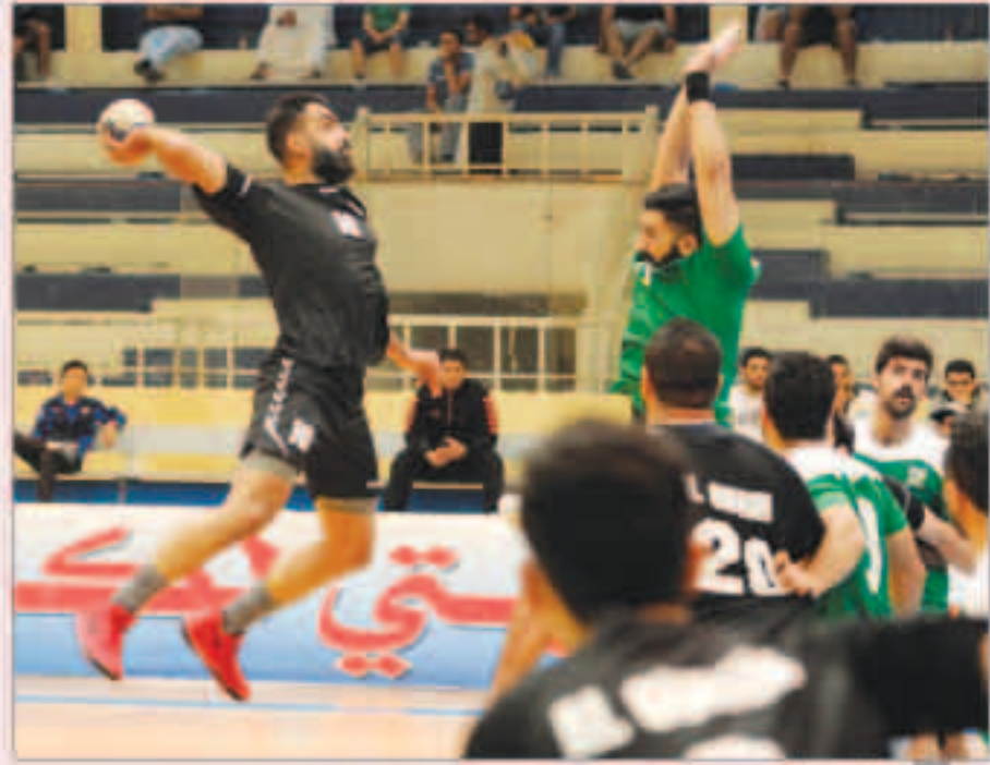
جانب من المباراة

فيما تجدد رصيد النصر عند ثلاث نقاط. وبدأت بطولة الدوري العام المحلي لكرة اليد في موسم (1966 - 1967) وحقق لقبها ثمانية فرق من أصل 16 فريقا سجلا لدى الاتحاد الكويتي لكرة اليد. ويتصدر نادي السيلية الفرق الحاصلة على لقب البطولة بـ 11 مرة يليه النادي العربي بـ 10 مرات ثم الكويت (حامل اللقب للموسم الختمة الماضية) بسبع مرات ثم كاظمة بست مرات والقادسية والصلبيخات بخمس مرات لكل منهما في حين حصل الفيحاء على اللقب أربع مرات وخيطان مرتين.