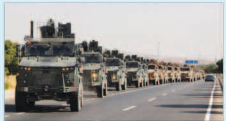
اليات عسكرية تركية في طريقها إلى سوريا

«وكالات»: أكد مصدر المرصد السوري لحقوق الإنسان، مساء السبت، دخول رتل عسكري للقوات التركية يحمل معدات لوجستية من معبر «كفرلوسين» شمال إدلب، يتألف من 20 آلية باتجاه منطقة خفض التصعيد.