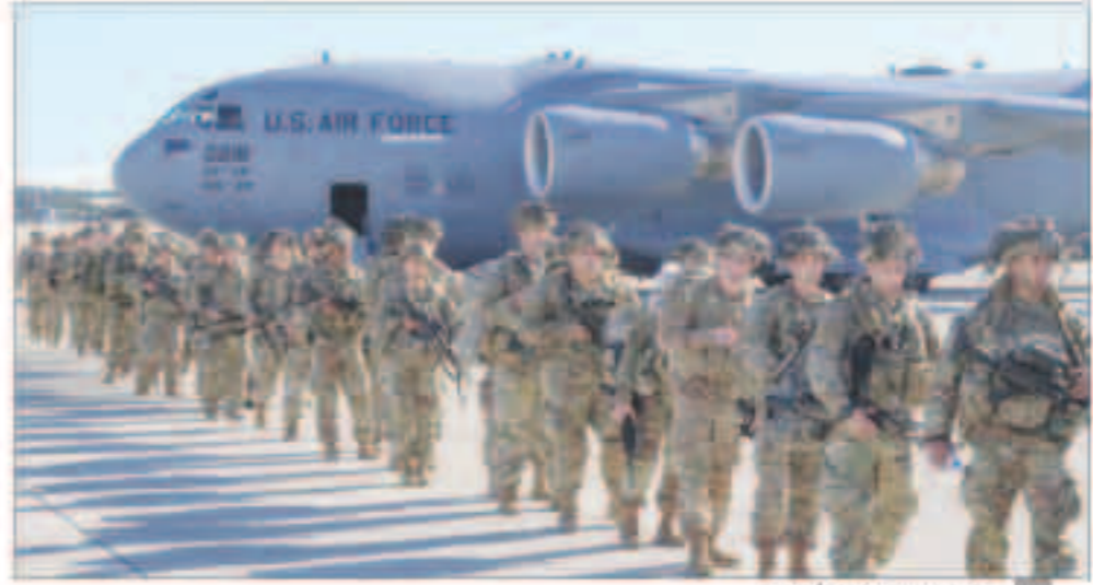
عناصر من الجيش الأمريكي

بغداد - «وكالات»: صرح المتحدث باسم القائد العام للقوات المسلحة العراقية اللواء الركن عبد الكريم خلف، أن العراق والولايات المتحدة الأمريكية سيبحثان في مفاوضات ستعقد في يونيو المقبل وضع الجدول الزمني لانسحاب القوات الأمريكية بشكل كامل من البلاد.