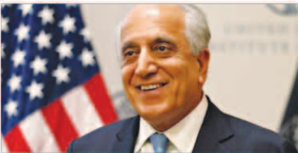
المبعوث الأمريكي الخاص للمصالحة الأفغانية ريتا خليل وآل

ويقترح أن يتم بوجوب الاتفاق بين الولايات المتحدة وطالبان، الذي تم توقيعه في أواخر فبراير، الإفراج عن 5 آلاف سجين من طالبان مقابل إفراج الحركة عن ألف شخص محتجز لديها من المؤيدين للحكومة قبل بدء محادثات السلام.