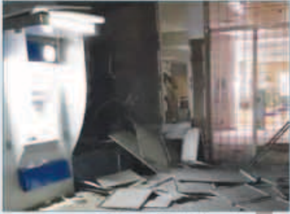
جانب من الدمار الذي لحق بمدخل المصرف

بيروت - «وكالات»: ألقي مجهولون قنبلة على فرع أحد المصارف الكبرى في لبنان السبت، في أحدث اعتداء يطل مؤسسة مالية في هذا البلد الذي يواجه أصعب أزماته الاقتصادية منذ عقود.