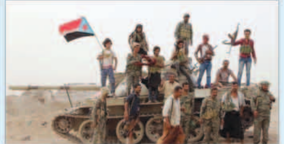
عناصر مسلحة في اليمن

عدن - «وكالات»: أعلن المجلس الانتقالي الجنوبي في اليمن الإدارة الذاتية في الجنوب بعد تعثر اتفاق لتقاسم السلطة تم توقيعه مع الحكومة اليمنية.