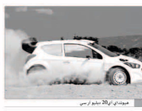
هيونداي آي 20 دبليو آر سي