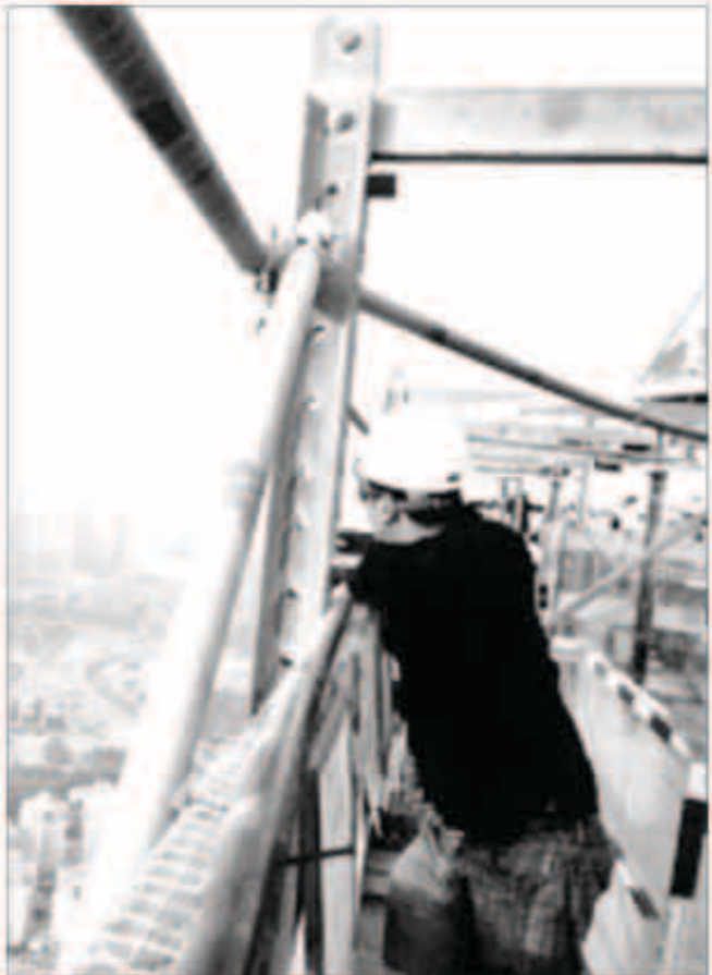
نمو قطاع البنية التحتية

«الدائرة الكهربائية الشمالية»، بينما يتم ربط الإمارات العربية المتحدة وعمان «الدائرة الكهربائية الجنوبية»، في المرحلة الثانية ويتم في المرحلة الثالثة ربط المرحلتين الأولى والثانية بعد إنجازهما، ويعد تحسين شبكة البنية التحتية أمرا بالغ الأهمية أن تؤدي زيادة الكفاءة والطاقة الناتجة من شبكة البنية التحتية إلى تحسينات دون الحاجة إلى مشاريع كبيرة للطاقة في المستقبل، على الأقل حتى ما يعادل طاقة قدرها 5,000 ميجاوات لكل دولة من الدول الأعضاء.