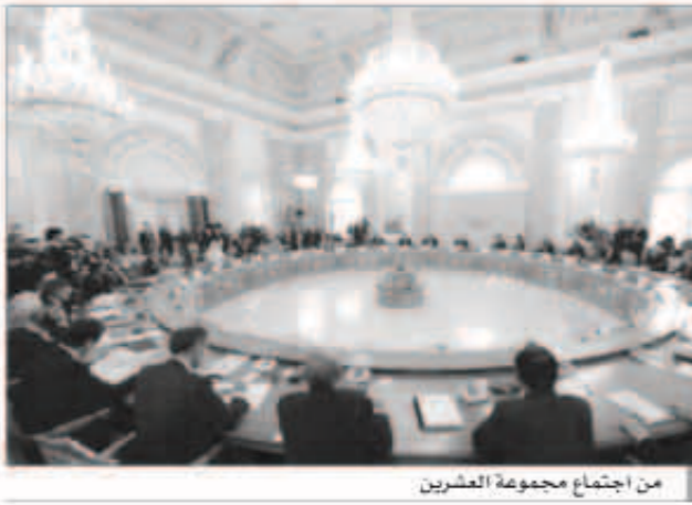
من اجتماع مجموعة العشرين

العالمي. وتشهد مجموعة العشرين - التي قادت جهود التصدي للأزمة الاقتصادية في 2009 - تعافياً متسارعاً حالياً مع تقدم الاقتصاد الأمريكي في حين يتحسن أداء اقتصاد أوروبا بينما تواجه الاقتصادات النامية انتكاسة جراء التقلص الوشيك للحفيز النقدي. وتوافق البيان الختامي الذي صدر في نهاية القمة التي استمرت يومين إلى حد بعيد مع البيان الذي أصدره وزراء مالية المجموعة في يوليو تموز حيث طالب بأن تكون التغييرات التي تدخل على السياسة النقدية «مدروسة بعناية». وقال البيان «ستطبق الاستراتيجيات المالية لأجل المتوسط... بشكل مرن لتأخذ في الاعتبار الظروف الاقتصادية في المدى القصير بهدف دعم النمو وتوفير الوظائف».