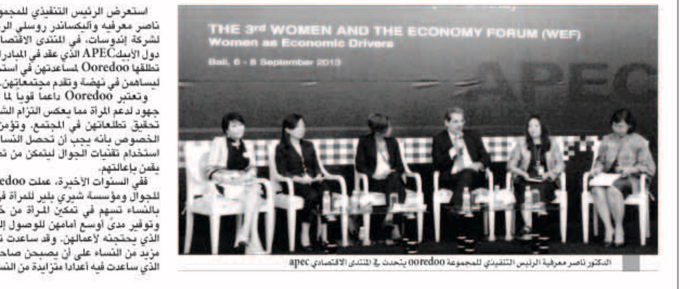
الدكتور ناصر معرفيه الرئيس التنفيذي للمجموعة ooredoo يتحدث في المنتدى الاقتصادي apec

استعرض الرئيس التنفيذي للمجموعة Ooredoo الدكتور ناصر معرفيه واليكساندر روسلي الرئيس والرئيس التنفيذي لشركة إنوسات، في المنتدى الاقتصادي الخاص بالنساء في دول اليبك APEC الذي عقد في المبادرات الخاصة بالنساء التي تطلقها Ooredoo مساعدهن في استخدام التقنية والابتكارات ليساهمن في نوضه وتقدم مجتمعاتهن. وتعتبر Ooredoo داعماً قوياً لما تقوم به دول اليبك من جهود لدعم المرأة مما يعكس التزام الشركة بمساعدة النساء في تحقيق تطعاتهن في المجتمع، وتؤمن Ooredoo على وجه الخصوص بأنه يجب أن تحصل النساء على فرص متكافئة في استخدام تقنيات الجوال ليتمكن من تطوير حياتهن وحيات من يقفن باعائتهن. وفي السنوات الأخيرة، عملت Ooredoo مع الاتحاد العالمي للجوال ومؤسسة شيري بليز للمرأة في إطلاق مبادرات خاصة بالنساء تسهم في تمكين المرأة من خلال تحسين الاتصالات، وتوفير مدى أوسع امامهن للوصول إلى المعلومات وإلى الدعم الذي يحتاجهن لأعمالهن. وقد ساعدت تلك المبادرات في تشجيع مزيد من النساء على أن يصبحن صاحبات مبادرات، في الوقت الذي ساعدت فيه أعداداً متزايدة من النساء في استخدام الإنترنت