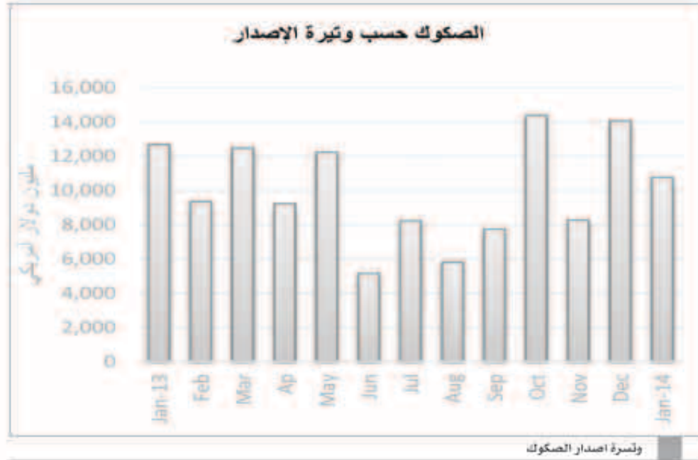
وتيرة إصدار الصكوك

وكانت حصة الريمجيت الماليزي من حيث عملة الإصدار بنسبة 46.7 في المئة من الإصدارات خلال الشهر وهي أدنى حصة منذ مارس 2013، بينما بلغت حصة الدولار الأمريكي 8 في المئة. وتم إصدار إجمالي 84 إصداراً للصكوك في يناير 2014 مقابل 126 في ديسمبر و53 في نوفمبر 2013. وكان نصيب قطاع الشركات من بين هذه الإصدارات 46 إصداراً بإجمالي مبلغ 1.7 مليار دولار «ديسمبر 2013: 9.3 مليارات دولار، بانخفاض بنسبة 81.4 في المئة»، في حين بلغ إجمالي إصدارات الهيئات السيادية من الصكوك 36 إصداراً بإجمالي مبلغ 7.8 مليارات دولار في يناير 2014 «ديسمبر 2013: 4.5 مليارات دولار أي بزيادة بنسبة 70.9 في المئة» فيما أصدرت الجهات الحكومية ذات الصلة إصدارين فقط في يناير 2014 بمبلغ 1.3 مليار دولار «ديسمبر 2013: 237.1 مليون دولار أي بزيادة بنسبة 445.4 في المئة».