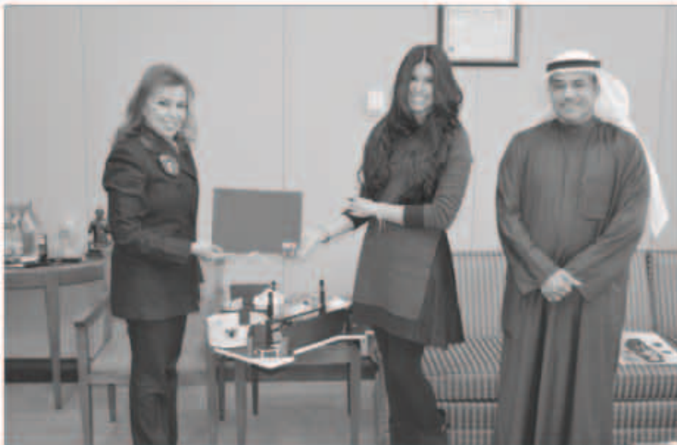
البحر خلال استقبالها بوعي واليزيد

البحر: البنك الوطني لن يدخر جهداً في دعم القضايا الإنسانية على مستوى العالم العربي كله