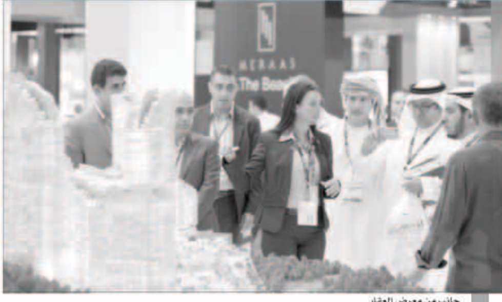
جانب من معرض العقار