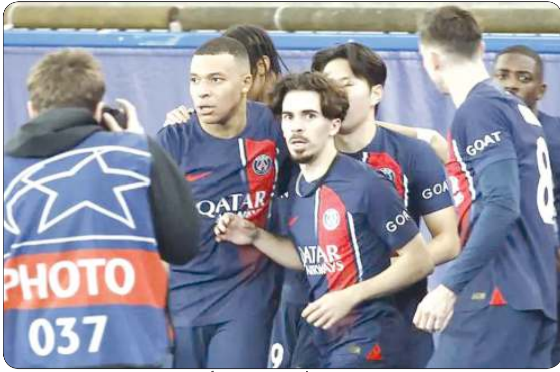
جيرمان يبحث غزو الملاعب الألمانية

وقاد الفريق إلى التتويج بكأس ألمانيا حين تولى منصب المدرب المؤقت في ديسمبر عام 2020، قبل أن يعلن عن التعاقد مع ماركو روز. وبقي ترزيتش في النادي كمدير فني واستلم تدريب الفريق قبل انطلاق موسم 2023-2022. وأنهى الموسم في الوصافة بعدما