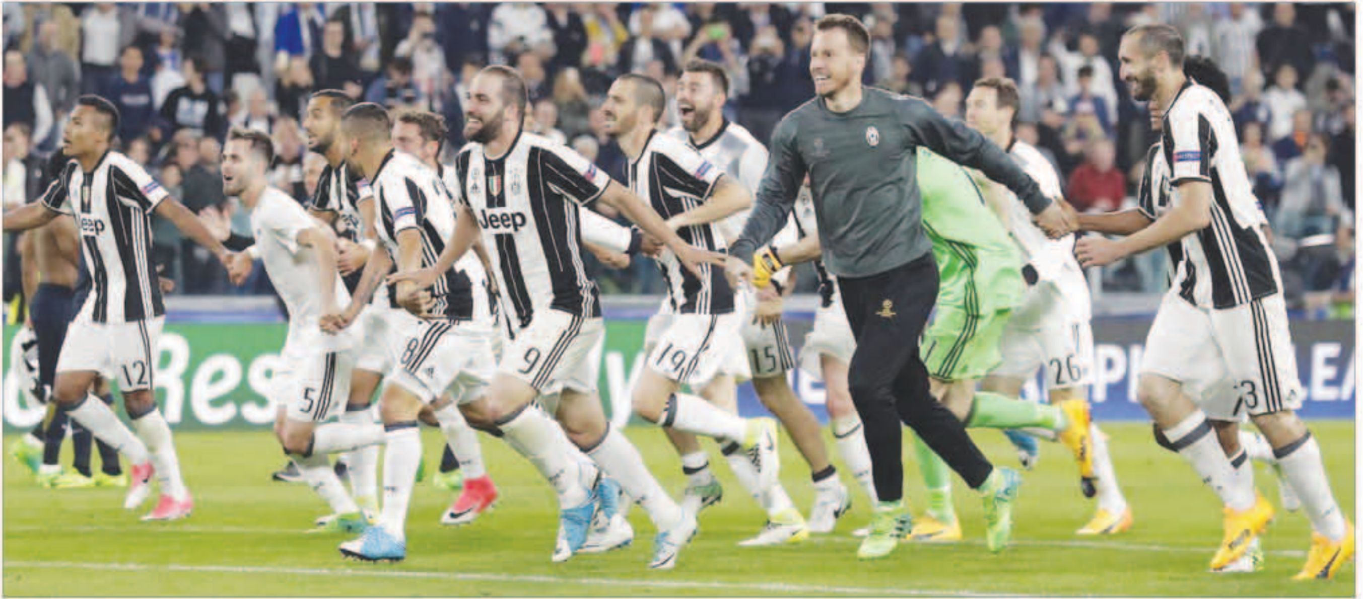
السيدة العجوز إلى نهائي الأبطال