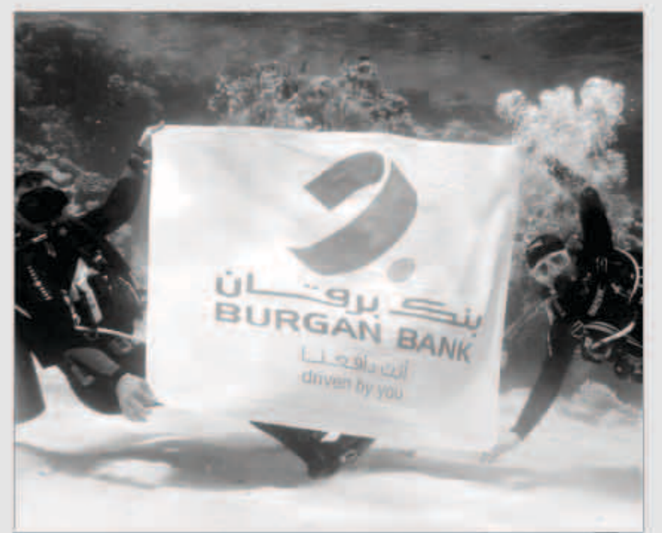
جانب من مبادرة بركان

في وقت يحتمل أن يتراجع فيه إنتاج النفط في دول «أوبك» بمقدار 51 ألف برميل يوميا ليبلغ بذلك المعدل الإجمالي للإنتاج المتوقع 27.3 مليون برميل حسب تقارير وكالة.