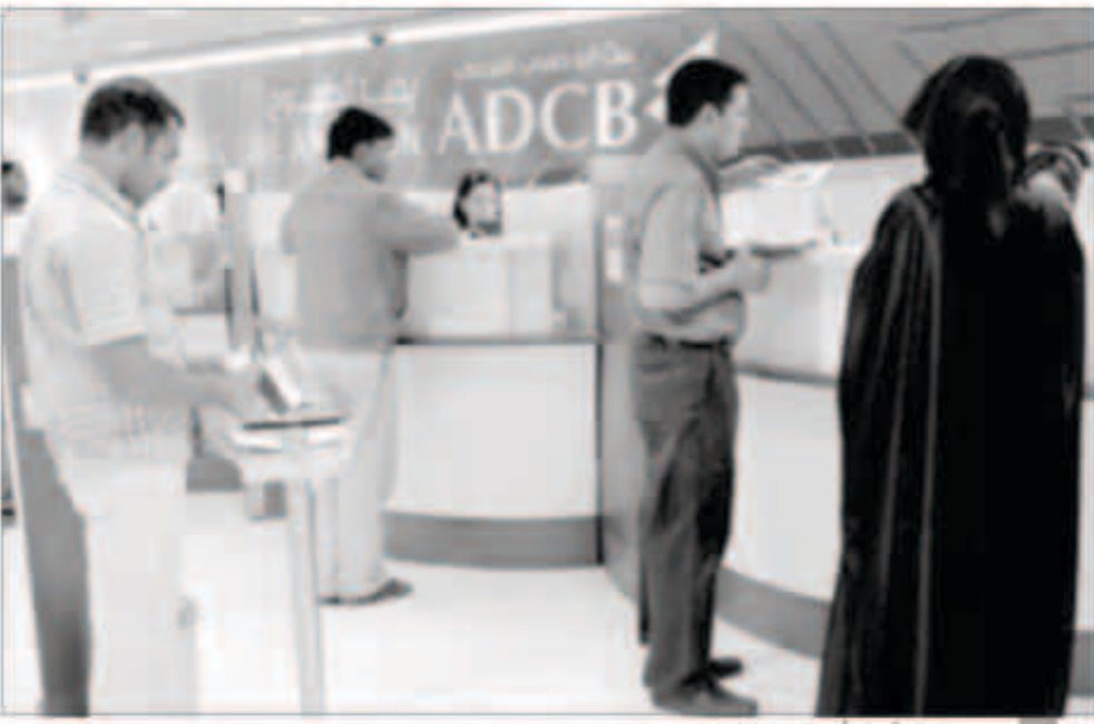
متماملون في بنك أبوظبي التجاري

وزادت قيمة القروض المقدمة من بنك الاتحاد الوطني بـ2.7 مليار درهم تعادل نمواً بنسبة 5 في المئة، ليرتفع رصيدها إلى 60 مليار درهم.