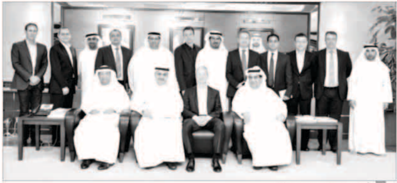
أعضاء مجلس إدارة مصرف الشارقة الإسلامي

وقم مصرف الشارقة الإسلامي اتفاقية مع شركة «تيمينوس» تقضي بتطبيق نظام الخدمات المصرفية الشاملة «تيمينوس T24»، والتي تتيح للمصرف مواصلة خدمات مميزة لعملائه. وتأتي الاتفاقية انسجاماً مع إستراتيجية تحديث البنية التحتية وخاصة تكنولوجيا المعلومات التي يتبناها المصرف، مما يعزز بتقديم منتجات وخدمات عصرية وحديثة للعملاء بما يواكب التقدم التكنولوجي.