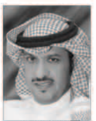
الشيخ خالد الخالد

أعلنت مؤسسة البترول الكويتية عن مشاركتها في المؤتمر العالمي لصناعة النفط والغاز 2012، OSEA2012، في بورتو اليناسعة عشر، والذي يناقش فيه قياديي الصناعة النفطية في القارة الآسيوية أبرز القضايا والتحديات التي تواجه الشركات النفطية في المنطقة، والمقام في الفترة من 27 إلى 30 نوفمبر الجاري في مركز «ساندر» للمعارض والتؤتمرات سنغافورة. وسيناقش المؤتمر عدد من المحاور الرئيسية المتعلقة بالقضايا العالمية للتحديات التي تواجه صناعة النفط والغاز في القارة الآسيوية والتي من أهمها الأوضاع الاقتصادية العالمية وتأثيرها في صناعة النفط والغاز في المنطقة، والابتكارات التقنية الثورية في العمليات الإنتاجية، وإدارة سلامة منشآت النفط والغاز البحرية، وتحديات استكشاف وإنتاج الغاز الطبيعي والغاز الطبيعي السائل. وفي هذا الصدد صرح الشيخ طلال الخالد الصباح العضو المنتدب للعلاقات الحكومية والبرلمانية والعلاقات العامة والإعلام أن المؤسسة تحرص على المشاركة في المحافل الدولية ذات الصلة بالصناعة النفطية لتعزيز تواجدها ومكانتها العالمية من خلال تبادل الخبرات حول أحدث ما توصلت إليه الصناعة