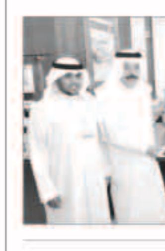
الجراح يقدم درهما لمحافظة حولي

احتفل بنك الكويت الدولي بافتتاح فرع له على مستوى محافظات الكويت، والثاني في منطقة حولي - شارع بيروت، وذلك بحضور محافظ حولي الفريق عبدالله عبدالرحمن الفارس، ورئيس مجلس إدارة بنك الكويت الدولي الشيخ محمد الجراح الصباح والرئيس التنفيذي لؤي مفاص. ويهدد المناسبة، أكد الجراح على أن افتتاح هذا الفرع قد جاء تطبيقاً لخطة التوسع والانتشار المحلية التي وضعتها البنك والتي تهدف إلى احتلال جغرافيا وتقديم خدمات «الدولي» التي العملاء في أي مكان في الكويت، وذلك بعد دراسة واختيار المواقع الاستراتيجية المهمة، حيث تعتبر محافظة حولي من أهم وأكبر المحافظات في الكويت، كما سوف يساهم هذا الفرع في وصول «الدولي» إلى شريحة كبيرة من عملائه لخدمتهم قرب أماكن تواجدهم وتوسيقهم، بالإضافة إلى تعريف العملاء الجدد بالخدمات المصرفية الإسلامية المتميزة التي تناسب احتياجاتهم. وأضاف الجراح قائلاً أن «الدولي» يسعى دوماً لتقديم خدمات مصرفية من الطراز الأول لعملائه ويهتم بتطوير خدماته المصرفية الإسلامية باستخدام أحدث الأساليب التكنولوجية المتوفرة في الصناعة المصرفية لتحقيق الحد الأقصى من رضا العملاء، وتقديم خدمات مصرفية إسلامية عصرية متطورة تضمها طيلانها في الدول المتقدمة، كما يولي اهتماماً خاصاً بتطوير منتجاته وخدماته المصرفية واستخدام التكنولوجيا المصرفية الحديثة في تجهيز فروع، بالإضافة إلى إعداد كوادر عالية التأهيل والخبرة من الموظفين لتقديم خدمات نوعية لعملائه.