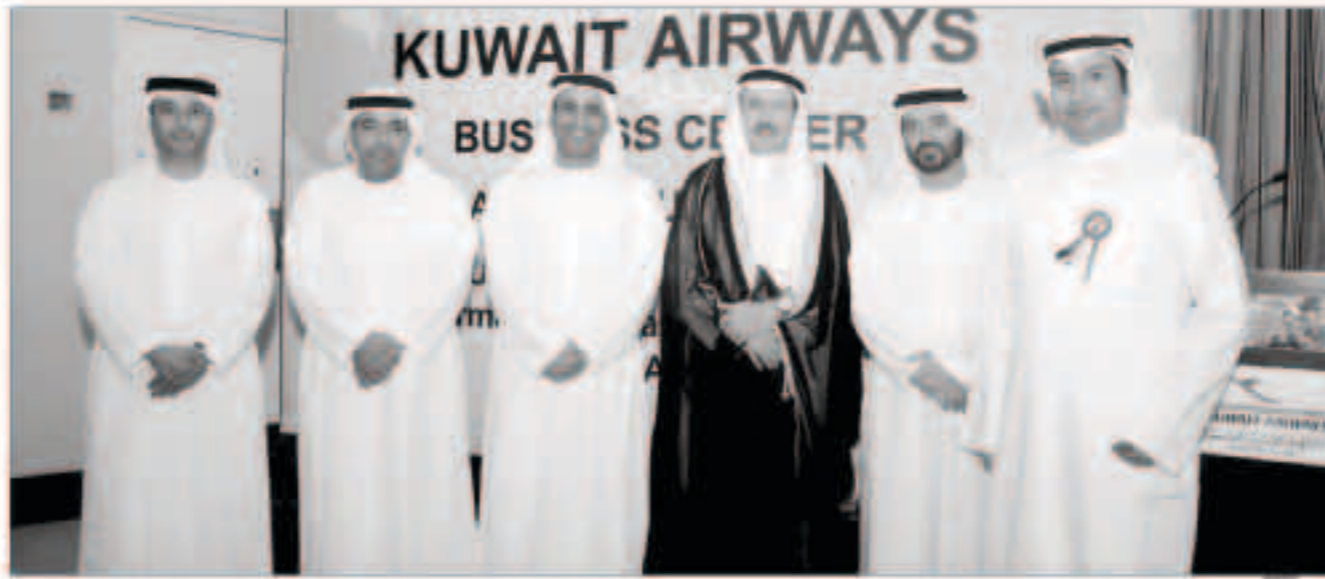
النصف مع عدد من المشاركين الحفل السنوي

الشركة تعمل في ملفات عدة بشكل متواز وأول المسارات تتعلق بالخيارات الوظيفية