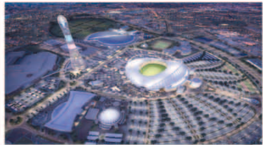
استاد خليفة الدولي