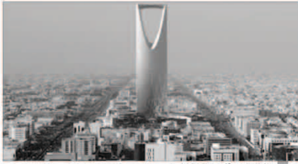
الشركات السعودية توسع استثماراتها بأوروبا

شهد سوق الأسهم السعودي، إعلان صفقتي استحواذ لشركات سعودية تملك شركات أوروبية كبرى في قطاعات السياحة والتجزئة، فيما توقع مصادر الإعلان عن صفقات أخرى وشيكة حال إتمامها. وبلغت قيمة صفقتي أعلنت عليهما مجموعتان سعوديتان في كل من بريطانيا نحو 146 مليون ريال، في توجه اعتبره محللون أنه مؤشر على المزيد من التوسعات الخارجية للشركات السعودية. واستحوذت شركة عطلات الطيران للسفر والسياحة، المملوكة لمجموعة الطيار القابضة، على شركة الجانت ريزورتس إحدى الشركات المملوكة لمجموعة توماس كوك البريطانية. وتعمل الشركة الأوروبية التي جرى الاستحواذ عليها، منذ أكثر من 25 عاماً في مجال تنفيذ البرامج السياحية والخطوط داخل وخارج بريطانيا لأوروبا وجزر الكاريبي ووسط وشرق آسيا. وارتفع سهم مجموعة الطيار، خلال جلسة اليوم إلى 124 ريالاً للشخص، بزيادة نسبتها 3.35 في المئة بتأثير من ثبات الصفقة. وشهد السهم تداولات بقيمة 36.4 مليون ريال من خلال تداول 299 ألف سهم نفذت عبر 444 صفقات حتى منتصف جلسة التداول.