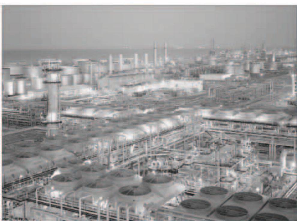
مصفاة رأس تنورة

مضافة إلى المشاريع البترولية السعودية التي يلاحظ توسعها في السنوات الماضية بصورة كبيرة. وتعتبر مصفاة رأس تنورة وهي أول مصفاة في المملكة للتكرير الزيت وأكبر مصفاة بالشرق الأوسط بطاقة إنتاجية تصل إلى 550 ألف برميل يوميا، وتلبي 31 في المئة من الطلب المحلي على المنتجات المكررة ومنتجات سائل الغاز الطبيعي، مما يجعلها عنصراً أساسياً في اقتصاد المملكة. فقد بدأت إنتاجها في عام 1941م كمصفاة تعمل بطريقة الغلف بغرض تجزئة الزيت الخام بمعدل 3000 برميل في اليوم، وتضاعفت طاقتها الإنتاجية لأكثر من 183 ضعفاً منذ إنشائها، ومن المتوقع أن يضاف إلى المصفاة خلال مشروع إعادة التأهيل مرافق لإنتاج المواد البترولية ومنتجات العطريات مثل براكسولين والناثا كم سيتم خفض نسبة الكبريت في المنتجات الحالية.