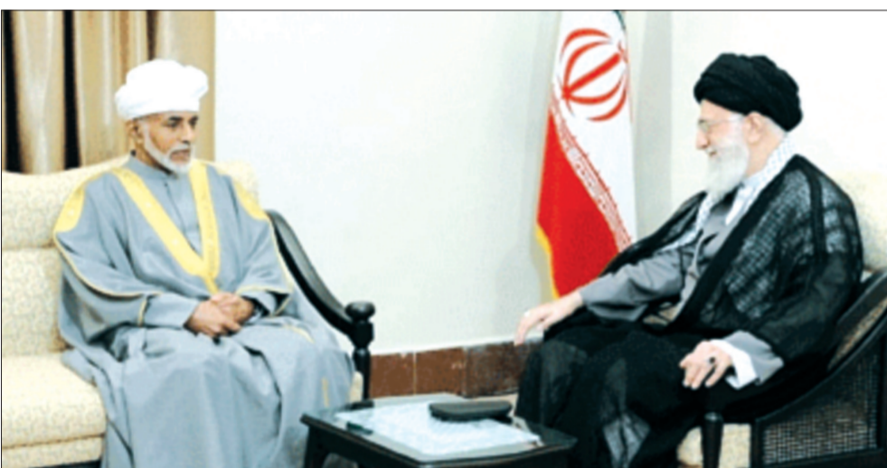
خامنئي خلال استقباله السلطان قابوس في طهران أمس

لا فروف: روسيا لن تخوض حرباً مع أحد حال التدخل العسكري في سوريا