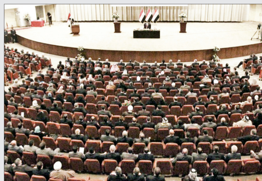
أغلبية البرلمان العراقي أقرت اتفاقية «الخور» ورفضت المزاييدات ضد الكويت