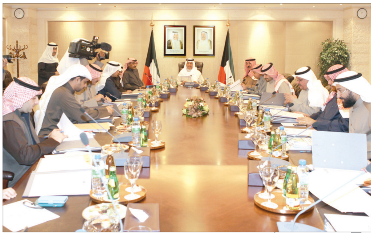
سمو الشيخ جابر المبارك مترئسا اجتماع مجلس الوزراء أمس

نهدف إلى تجنب المزيد من التعقيدات التي سيكون لها آثار ومضاعفات بالغة الخطورة على مختلف المستويات