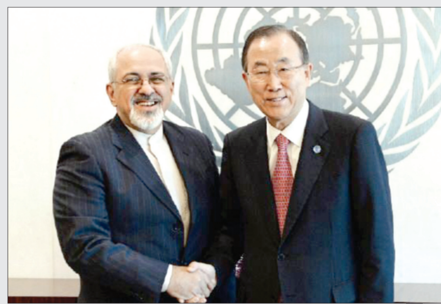
بان كي مون خلال لقاء أخير له مع وزير الخارجية الإيراني