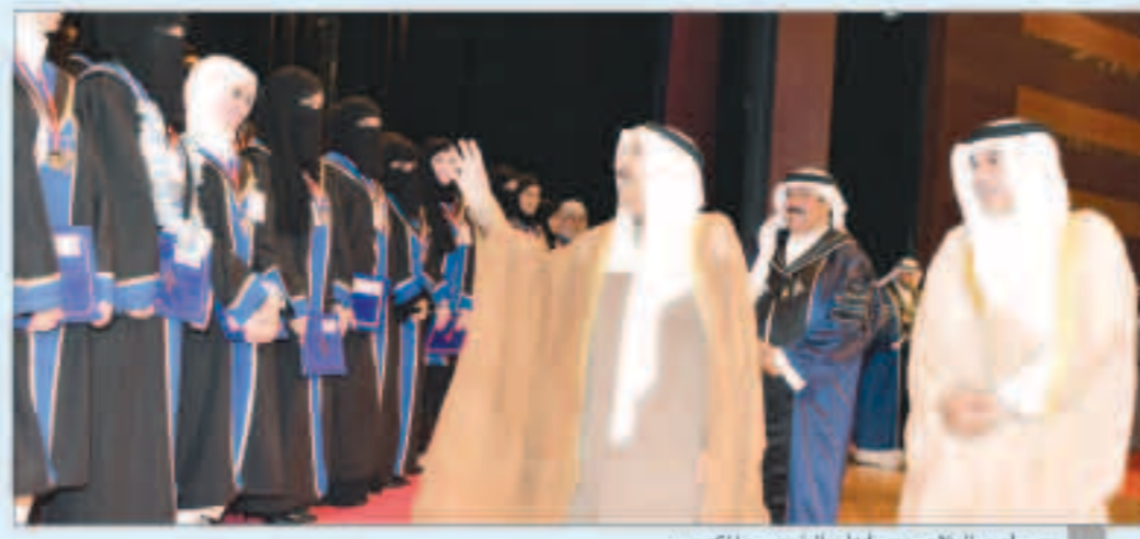
سمو أمير البلاد يحيي أبناء الخريجين المكرمين

شمل صاحب السمو أمير البلاد الشيخ صباح الأحمد ، بحضوره ورعايته الاحتفال الذي أقيم صباح أمس لتكريم المتفوقين من خريجي كليات ومعاهد الهيئة العامة للتعليم التطبيقي والتدريب ، للعام الدراسي 2018/2017 ، وذلك على مسرح ديوان عام الهيئة الجديد بمنطقة الشويخ. وأكد فيها أن الهدف الرئيس الذي نؤخره الدولة بإنشاء كليات التعليم التطبيقي توفير القوى الوطنية الفنية العاملة ، وتزويد البلاد بالعمالة المدربة المطلوبة في مجالات الإنتاج المختلفة ، بما يفي بمتطلبات