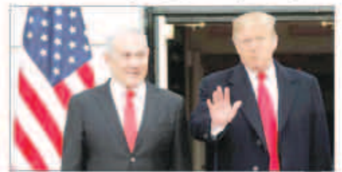
ترامب و نتنياهو

واشنطن - «وكالات» : وقع الرئيس الأمريكي دونالد ترامب أمس ، إعلاناً يعترف بسيادة إسرائيل على هضبة الجولان المحتلة. وشكر رئيس الوزراء الإسرائيلي ، الذي شهد مراسم التوقيع في البيت الأبيض ، الرئيس الأمريكي على هذا الاعتراف. وأشار ترامب إلى أن الجولان سيمطر عليها الجيش الإسرائيلي خلال ما وصفه بحرب دفاع عن النفس ضد السوريين.