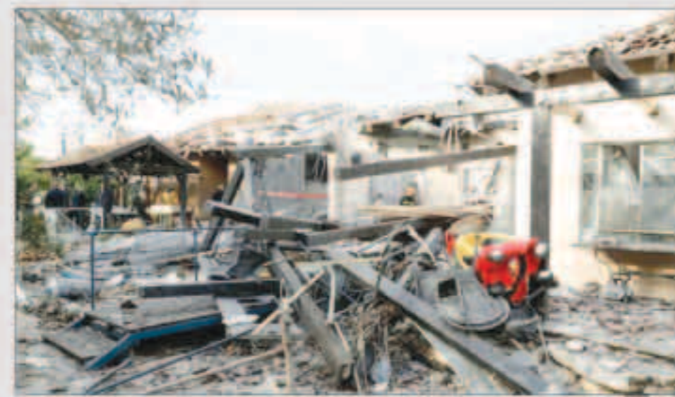
جانب من التدمير الذي أحدثه الصاروخ في وسط إسرائيل

نتنياهو يقطع زيارته لواشنطن : هجوم بشع على بلادنا وسنرد بقوة جيش الاحتلال يرسل تعزيرات إلى الحدود مع القطاع تاهباً لعملية عسكرية مرتقبة