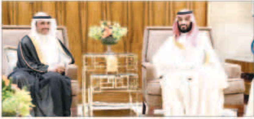
الفانم : لن توفي أي كلمات أو تصريحات حق السعودية قيادة وشعباً