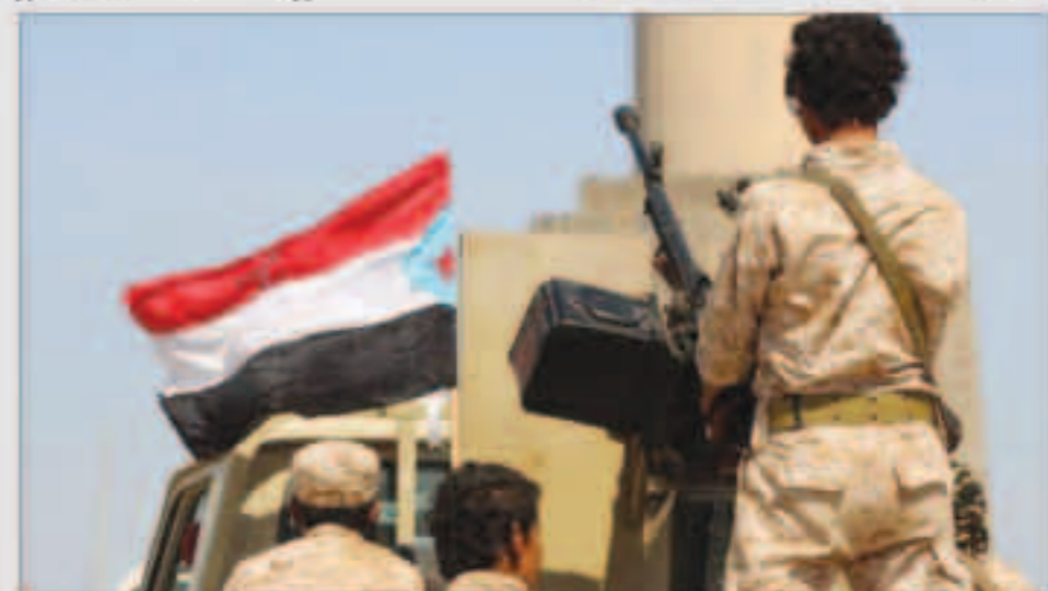
مقاتلون من قوة الحزام الأمني التابعة للمجلس الانتقالي الجنوبي متوجهين أسير من خان إلى محافظة أبين

في تحد خطير لحكومة هادي المعترف بها دولياً