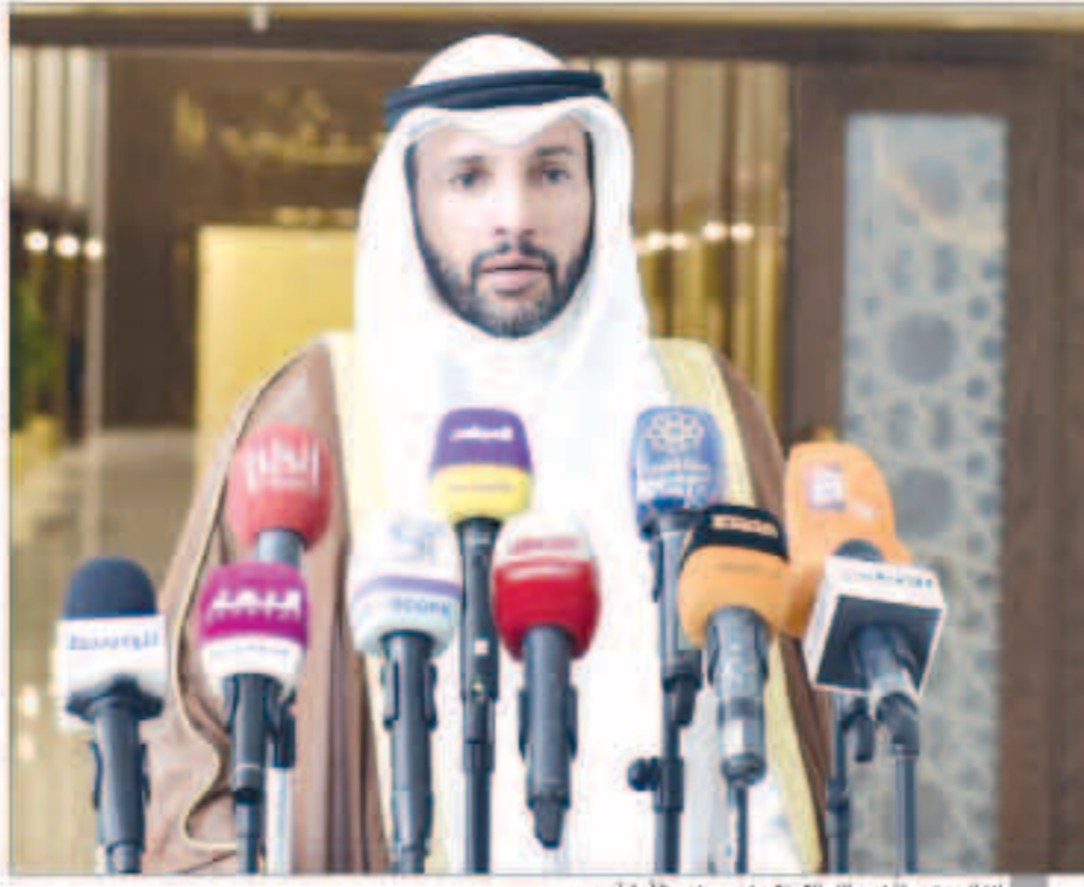
الغانم متحدثاً لوسائل الإعلام في مجلس الأمة أمس

مكتب المجلس يجتمع اليوم للتباحث في مدى الحاجة لعقد جلسات لإقرار القوانين ذات الصلة بأزمة «كورونا»