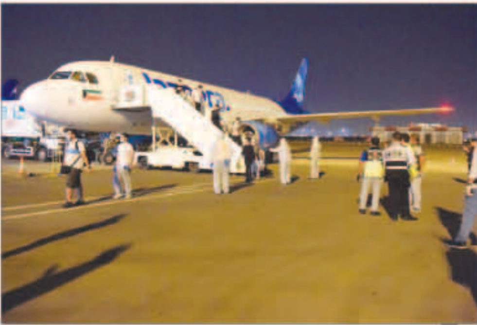
تجراح كبير حققته المرحلة الثانية لإجلاء الكويتيين... والثالثة تبدأ اليوم

سالم الجابر : الرحلات ستنتقل من واشنطن ولوس انجلوس وميامي ودالاس وتكساس بواقع رحلة يومية