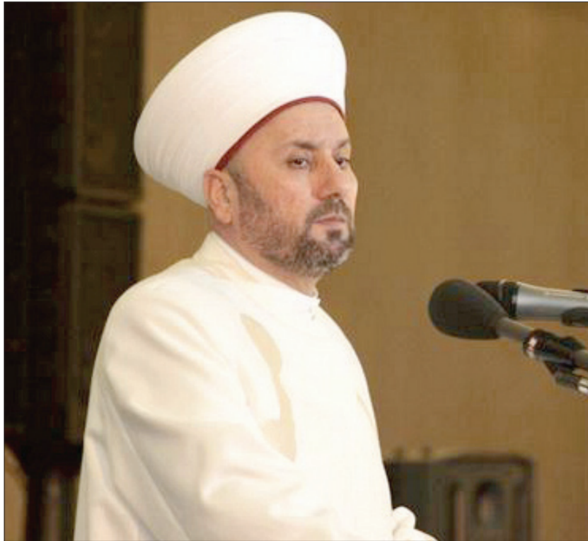
مفتي العراق الشيخ رافع الرفاعي

تفتيش الموقع أسفر عن ضبط سلاحين ناريتين وكمية كبيرة من الذخيرة وواق من الرصاص