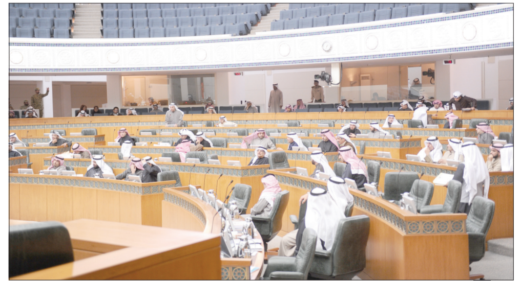
المجلس سيستقبل قريباً لجنة تحقيق جديدة في مشروع الوقود البيئي

«الإطفاء» تعلن إصابة 11 عامل بناء إثر الحادثة