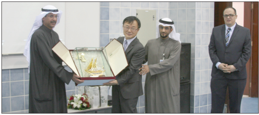
الأثري: حريصون على تنمية مهارات الطلبة لتلبية احتياجات سوق العمل