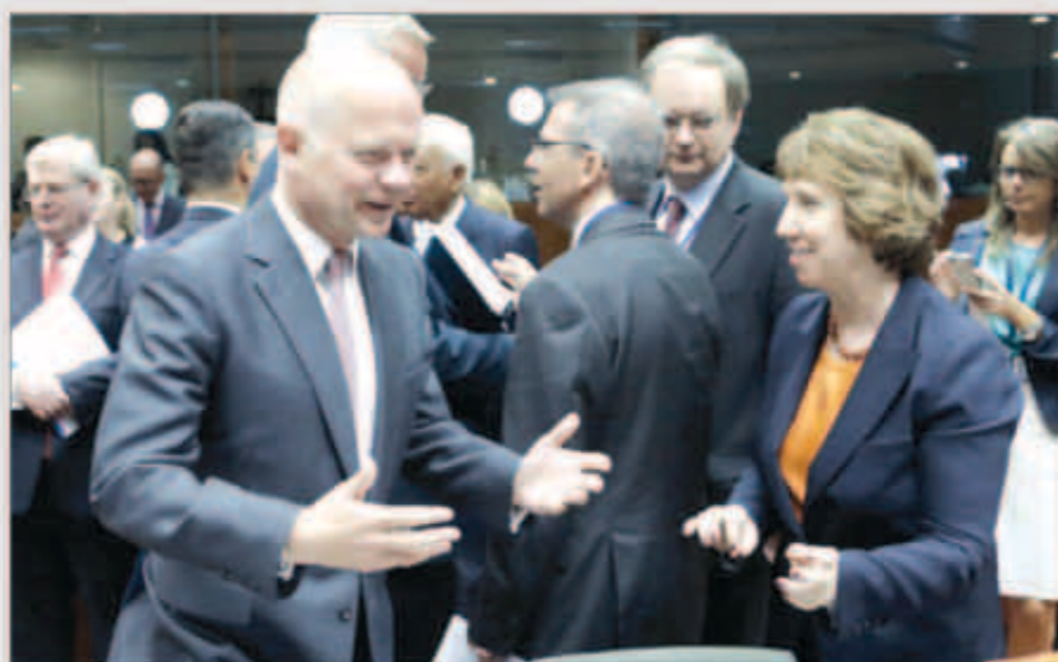
وزراء خارجية أوروبا اتفقوا على معاقبة النظام السوري

الهيكلة: بدء التسجيل في المكافأة الاجتماعية للخريجين الخيس