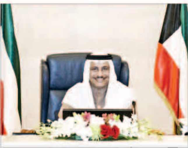
المبارك مترشحاً لاجتماع مجلس الوزراء