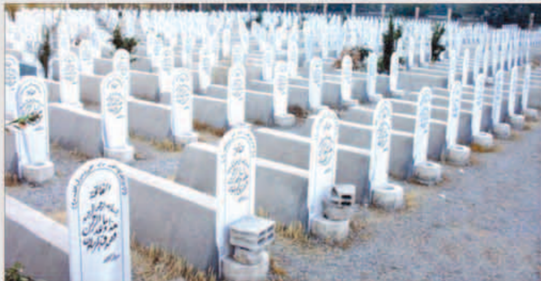
مئات القبور بلا أسماء في دمشق.. أحد تجليات الأزمة السورية

صورة المقبرة بلا أسماء تعود ملكيتها لعلاء المصور الأساسي