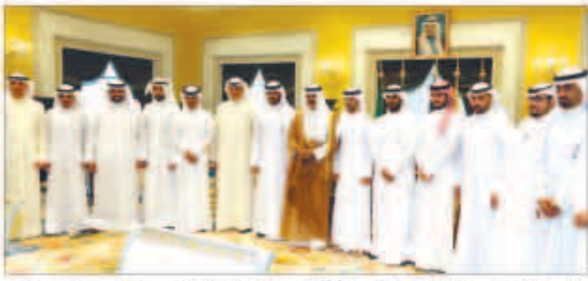
ولي العهد: العلم والمعرفة ضروريان لبناء مجتمع عصري