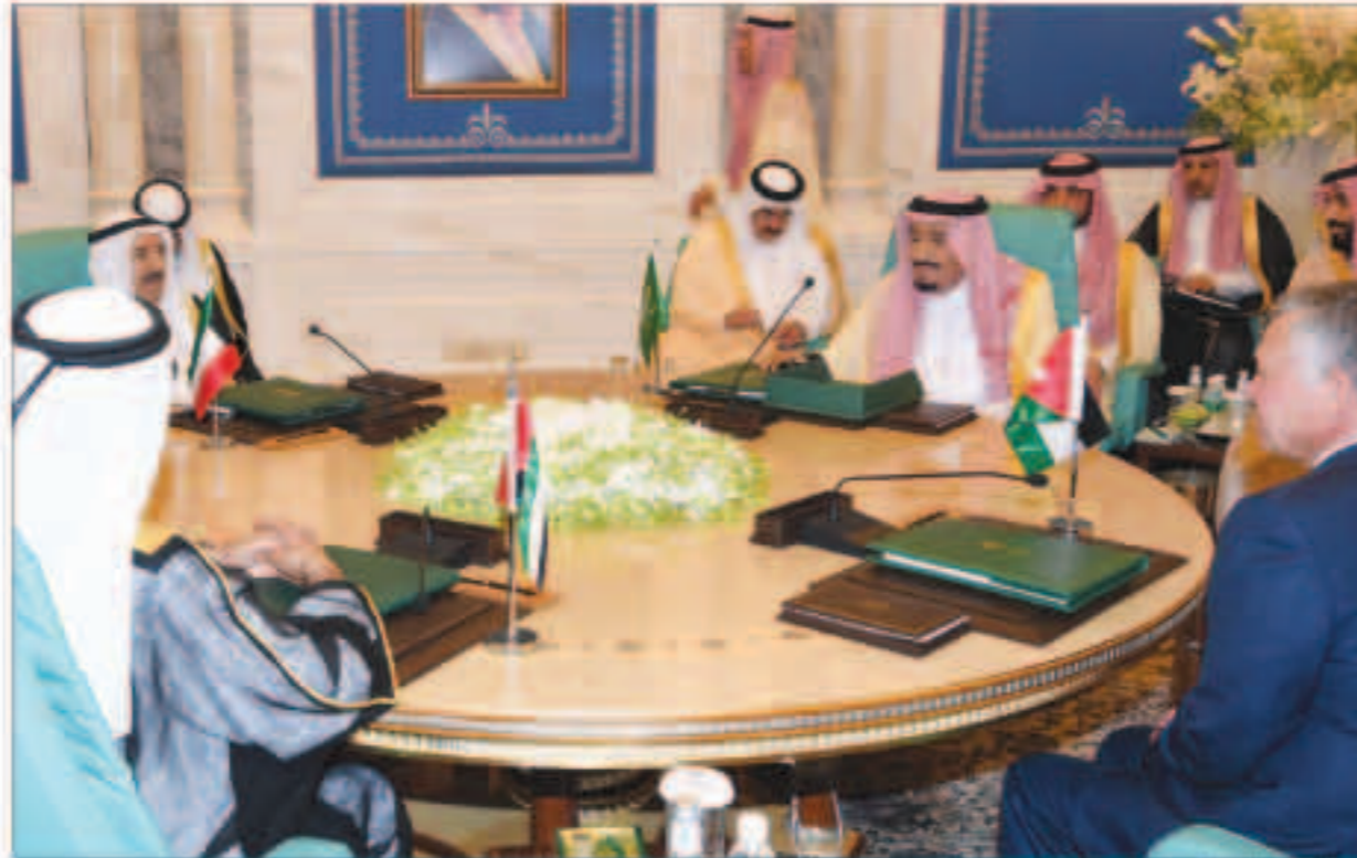
صاحب السمو الأمير وخادم الحرمين الشريفين والعمال الأردني والشيخ محمد بن راشد خلال لقائهم في مكة المكرمة

عبدالله الثاني: كل الشكر والامتنان للسعودية والكويت والإمارات على تقديم هذه الحزمة من المساعدات التي ستسهم في تجاوز بلادنا للأزمة الجبير مبادرة خادم الحرمين لدعم الأردن تؤكد حرص المملكة على استقرار أشقائنا السياسي: أقدر جهود الملك سلمان الحثيثة لتعزيز التضامن بين الأشقاء، ودعم المواقف العربية على الأصدقاء كافة