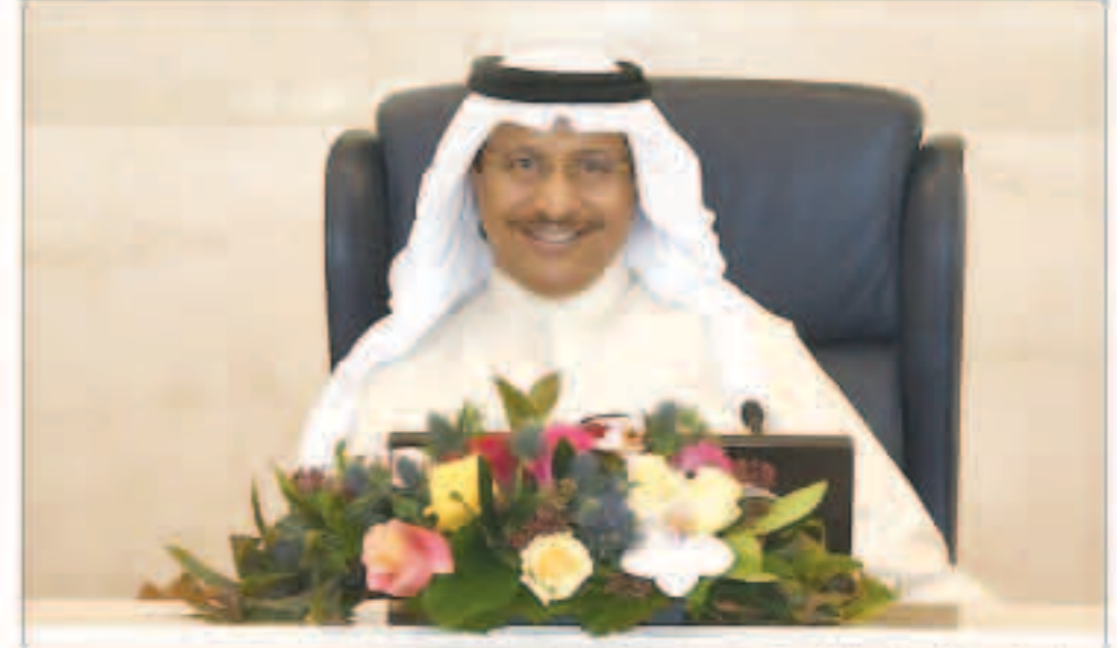
سمو الشيخ جابر المبارك مترشحاً لاجتماع مجلس الوزراء

ترقب دولي لأن تغير مخراجات القمة التاريخية الوضع الأمني بالمنطقة تغييراً جذرياً