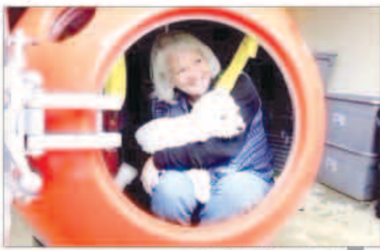
جين جونسون الوطلة لدى مايكروسوفت

«وكالات»: اشترت أمريكية تقطن في شبة جزيرة لونغ بيتش بولاية واشنطن كبسولة الإقناع أو البقاء على قيد الحياة المضادة لخلف الكوارث الطبيعية، مثل موجات المد البحري «تسونامي» والزلازل والحرائق الشديدة وأي كارثة أخرى بسعر 13.500 دولار أمريكي، لتصبح أول شخص في العالم يفتني منزلاً يقي حياته من التقلبات الجوية الخطيرة».