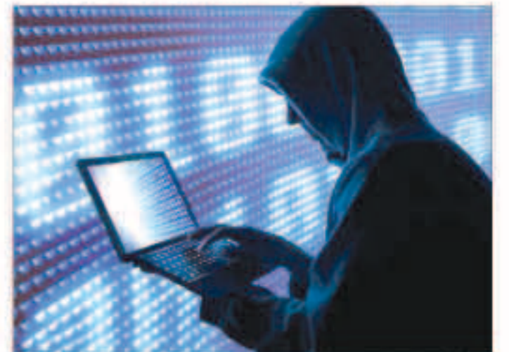
رجل يعمل على جهاز كمبيوتر محمول

وقال المتحدث باسم الوكالة إن أحدث توصيات ركزت على التشفير وحماية كلمات المرور وخطوات تحسين أنظمة الكمبيوتر والشبكات».