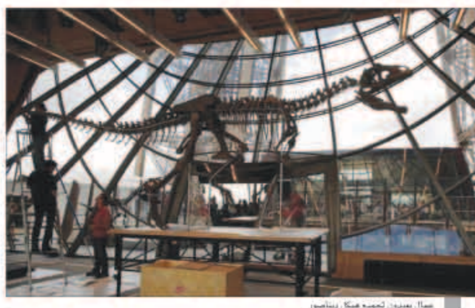
عمال يجمعون هيكل ديناصور

باريس - «رويترز»: بيع هيكل ديناصور من نوع غير معروف عوله تسعة أمتار ويعتقد إنه من سلالة لم تكتشف من قبل مقابل أكثر من 2.3 مليون دولار في مزاد نظم في الطابق الأول من برج إيفل في باريس.