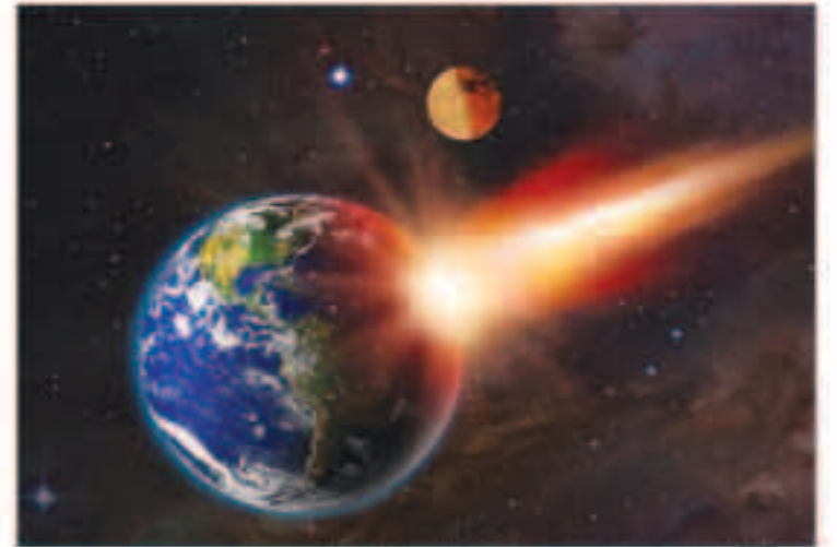
العلماء يشنون في رصد كويكب سقط على إفريقيا

وهذا يعني أن هناك الكثير من الأجرام الصغيرة، التي لا تستطيع وكالة «ناسا» رصدها.