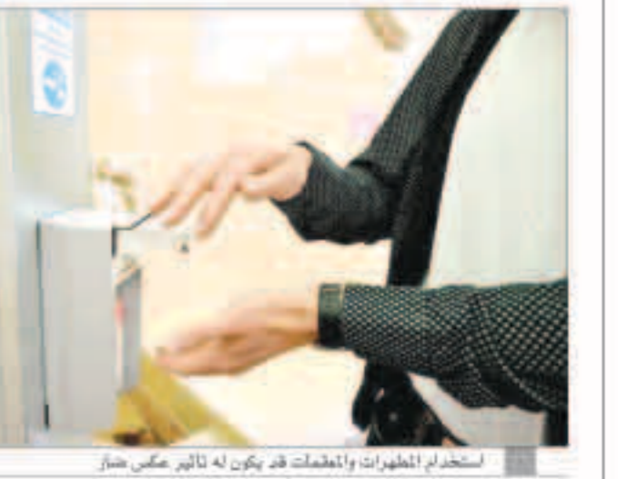
استخدام المطهرات والمعقمات قد يكون له تأثير عكس صاف

«وكالات»: منذ بداية تفشي فيروس كورونا الجديد، والطلب العلماء على نصح الناس بشأن أفضل ممارسات النظافة لحماية أنفسهم، ومنها الحرص على تعقيم اليدين. وتسببت هذه النصيحة في زيادة كبيرة في بيع واستخدام منتجات التنظيف ومعقمات اليدين، لكن لسوء الحظ، نادراً ما تأتي هذه التعليمات مع عوالب إساءة الاستخدام. ومثلما هو الحال مع سوء استخدام المضادات الحيوية، يمكن أن يؤدي الاستخدام المفرط لمنتجات التنظيف ومعقم اليدين إلى أن تطور البكتيريا والجراثيم مقاومة مضادة، الأمر الذي يثير قلقاً من الإفراط للفتاوى في استخدام هذه المنتجات أثناء فترة تفشي وباء كوفيد-19. وبالتالي إمكانية أن يعود ذلك إلى زيادة عدد الأنواع البكتيرية المقاومة التي تواجهها. وتعتبر مضادات الميكروبات المختلفة، بما فيها المضادات الحيوية والأدوية المضادة للفطريات والفطريات وغيرها، مهمة لصحتنا، فهي تساعدنا في مكافحة العدوى، ومع ذلك، يمكن لبعض الكائنات الحية، مثل البكتيريا، أن تتغير أو تتحول بعد تعرضها للمضادات.