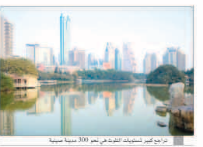
تراجع كبير لمستويات التلوث في نحو 300 مدينة صينية

«وكالات»: قال مسؤول صيني محلي في بكين، أمس، إن مقاطعة هبي الشمالية المعرضة للضباب الدخاني، القريبة من بكين، حققت أهدافها الخاصة بجودة الهواء بهامش كبير خلال فصل الشتاء بعد جهود متضافرة لمعالجة الانبعاثات. دون ذكر إغلاق المصانع ذات الصلة بفيروس كورونا المستجد. وأحمد نائب رئيس مكتب البيئة الإقليمي، هي لينياو، بأن متوسط تركيزات جسيمات «بي إم 2.5» في الهواء خلال الفترة من أكتوبر إلى مارس انخفض بنسبة 15 في المئة عن العام السابق، لتصل إلى 61 ميكروغرام لكل متر مكعب، في حين انخفضت مستويات ثاني أكسيد الكبريت أيضاً بنسبة الثلث، حسبما أفادت رويترز. وأرجع معظم الخبراء الانخفاض الكبير في تلوث الهواء في جميع أنحاء الصين في الربع الأول إلى تفشي فيروس كورونا الجديد، وندابير الإحتواء الصارمة، التي شهدت إغلاق المدن والمطارات بأكملها وخفضت بشدة حركة المرور والنشاط الصناعي في جميع أنحاء البلاد.