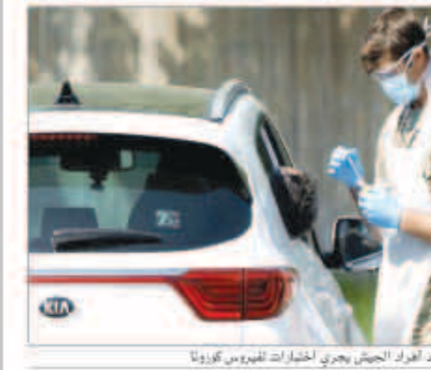
أحد أفراد الجيش يجري اختبارات الفيروس كورونا

«رويترز»: بدأت ثمانية وحدات متنقلة يديرها أفراد من الجيش على التنقل عبر بريطانيا لإجراء اختبارات فيروس كورونا على أن ثلثها عشرات الوحدات الأخرى لمساعدة الحكومة على الاقتراب من تحقيق هدفها بإجراء 100 ألف اختبار يومياً لفيروس كورونا المستجد. وكان وزير الصحة مات هانوك قد وعد بإجراء هذا العدد من الاختبارات اليومية بحلول 30 أبريل ولكن بحلول يوم الجمعة لم يتم إجراء سوى 28760 فقط. وقالت وزارة الصحة في بيان أمس إن تلك التركيبات للعدلة ستقوم بأخذ مسحات من الحلق ثم إرسالها إلى مختبرات لمعالجتها. وسليداً 96 وحدة أخرى بالعمل خلال شهر مايو. ويمكن إقامة هذه الوحدات خلال أقل من 20 دقيقة وتجرى اختبارات للعاملين الأساسيين مثل من يعملون في دور رعاية المسنين والتشرطة والسجون. وهناك مخاوف من إمكان أن يؤدي نقص الاختبارات إلى إبطاء خروج بريطانيا التدريجي من العزل العام ويؤخر تعافي الاقتصاد.