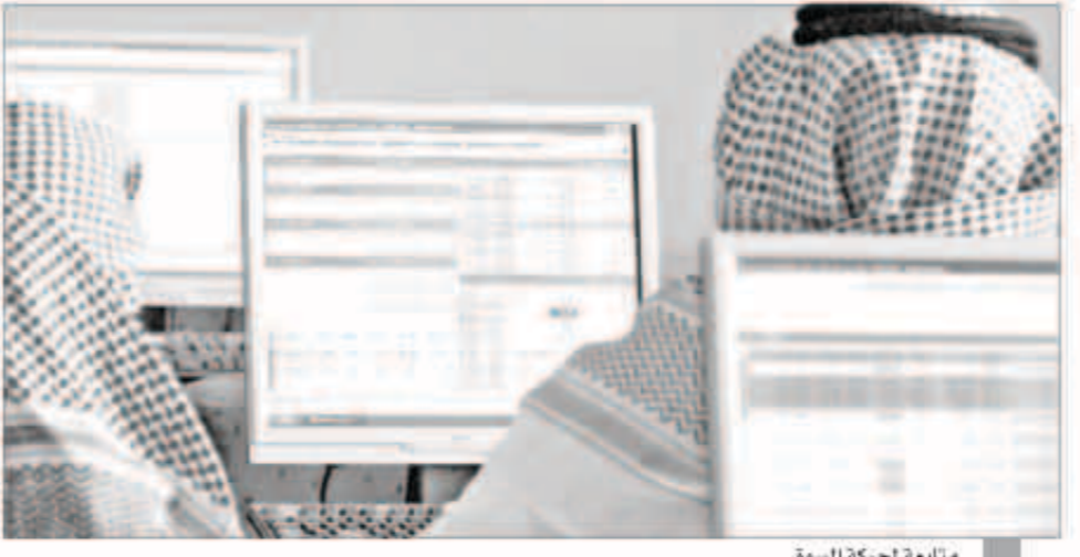
متابعة لحركة السوق

أغلق المؤشر العام لسوق الأسهم السعودية جلسة نهاية الأسبوع على خسارة 21 نقطة ليقتطع الحاجز النفسي 8000 الذي حافظ عليه ثلاث جلسات متتالية. ويواصل الهبوط لليوم الثالث على التوالي. وجرت السوق للانخفاض ثمانية من قطاعات السوق الـ 15. كان من أكرها تضرراً قطاعا التشييد والاستثمار الصناعي، ومن أكبرها تأثيراً على السوق قطاعا البتروكيماويات والبنوك. ونتيجة للبيع المكثف على السوق زادت ثلاثة من أبرز خمس كميات وحجم للسوق بينما تراجع عدد الأسهم المصاعدة ونسبة سيولة الشراء ما يعني أن السوق كانت في حالة بيع. إلى هذا أغلق المؤشر العام لسوق الأسهم المحلية آخر جلسات الأسبوع على خسارة 21 نقطة، بنسبة 0.26 في المئة، نزولا إلى 7981 خلال عمليات كانت الغلبة فيها للبايعين ما نتج عنه اكتساء ثمانية قطاعات و116 شركة بالون الأحمر. ومن بين 15 قطاعا في السوق ارتفعت سبعة بينما تراجعت ثمانية بصدارة قطاع التشييد