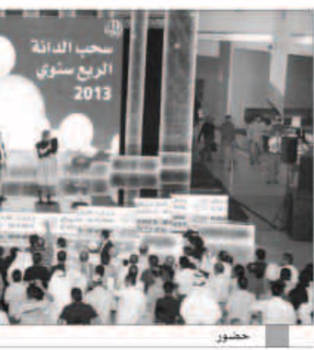
هديل الفضلي تعلن أسماء الفائزين