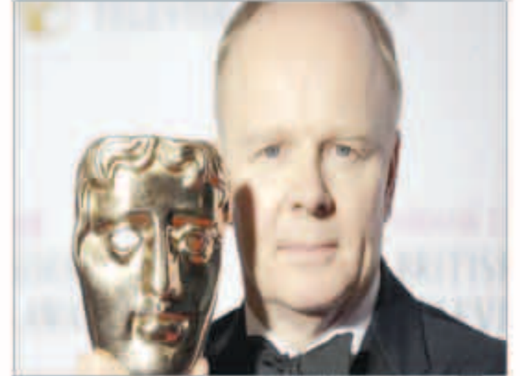
روبرت داووني جونز يحمل فيلم «الفنجرز»

«رويترز» : حافظ فيلم الحركة والخيال العلمي «الفنجرز: إيدج أوف الترون» على صدارة إيرادات السينما في أمريكا الشمالية خلال الأيام الثلاثة الماضية وجمع قرابة 77.2 مليون دولار. الفيلم بطولة روبرت داووني جونز وكريس إيفانز ومارك روفالو وسكارليت جوهانسون ومن إخراج جوس ويدن. واحتل فيلم الحركة والتكوميديا الجديد «هوت بروس»، للممثلة ريس وينديسون المركز الثاني مسجلاً 13.3 مليون دولار. شارك في بطولة الفيلم صوفيا فرجارا وماتيو ديل نيغرو وتخرجه أن فليتنر. وقل الفيلم الدراسي «ذي إيدج أوف اداين» في ترتيبه بالمركز الثالث للأسبوع الثاني على التوالي بإيرادات قدرها 5.6 مليون دولار. يقوم بطولة الفيلم بليك لايفلي وميخا هوشمان وهاريسون فوردي ويخرجه لي تولايد كزجر. وتراجع الجزء الجديد من سلسلة الأفلام «فاست اند فورياس» (فيورياس 7) إلى المركز الرابع مسجلاً 5.2 مليون دولار. الفيلم بطولة الممثل الراحل بول ووكر وفين ديزل ودواين جونسون ومن إخراج جيمس وات. ونزل أيضاً فيلم الحركة والتكوميديا «بول بارت مول كوب 2» من المركز الرابع إلى الخامس هذا الأسبوع يسجل 5.1 مليون دولار. يقوم بطولة الفيلم كيفن جيمس ورايتي رودريجز ويخرجه اندي فيكمان.