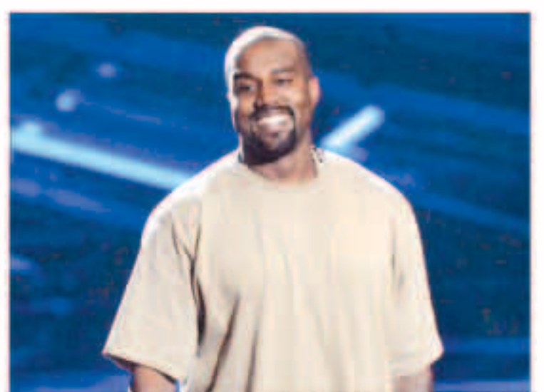
المغني كاني وست يقبل كلمة في حفل توزيع جوائز ام.تي.في

وبعد التعامل معه باعتباره مزحة فجر طموح وست والرئيس موجة من الصور التي وضعت وجهه على اللصق الدعائي الشهير لحملة باراك أوباما للرئاسة (هوب) كما تم تركيب صورته على جبل راشمور لتحتوي عليه وجوه الرؤساء الأمريكيين أبراهام لينكولن وتوماس جيفرسون وتيودور روزفلت. وانظرت استطلاعات رأي ساخرة تقدم وست على المرشح الجمهوري الأبرز حاليا دونالد ترام فيما ركبت بعض الصور التي تظهر بها كيم وشقيقتهما كولي وكورتني كارديشان خارج البيت الأبيض.