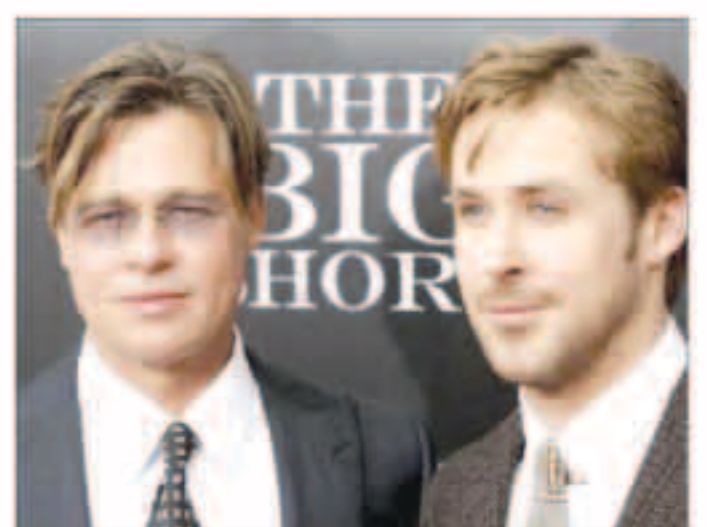
براد بيت ومات دامون في العرض الأول لفيلم «ذا بيج شورت»

وأثار الافتقار للتنوع للتعلم الثاني على التوالي حملات على مواقع التواصل الاجتماعي ودعوات للمقاطعة شملت ممثلين بارزين منهم ويل سميث والخرج سبارك لي وأقرت ديدي جاردنر منتجة فيلم (ذا بيج شورت) بوجود هذه المشكلة لدى تسلمها الجائزة وقالت «نعم لدينا مشكلة كبيرة تحتاج لرواية قصص نكس عائلنا وبلدنا.»