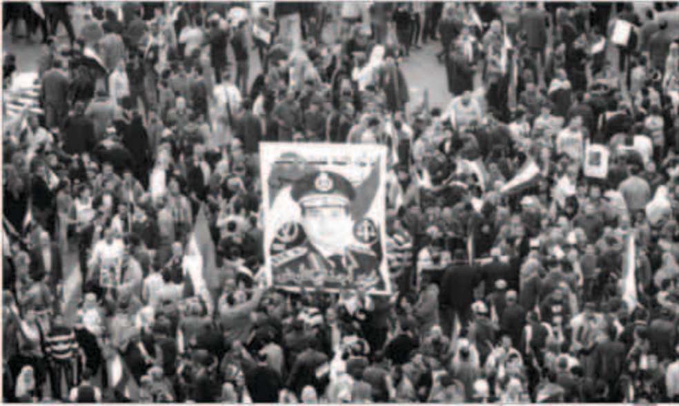
متظاهرون حملوا صوراً لثوبك دعمهم لترشيح السيسي للرئاسة

■ «الصحة»: 49 قتيلاً ومئات الجرحى خلال أعمال العنف التي صاحبت احتفالات السبت