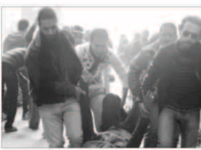
متظاهرون يحاولون اسعاف أحد ضحايا أعمال عنف الامس

«مصممون دولة وشعباً... على استكمال خارطة المستقبل». وقال منصور، «تعرضت لعمليات إرهاب سوداء ذهب ضحيتها إرهاب وعناصر من الجيش والشرطة»، معتبراً أن تلك الهجمات «تستهدف كسر إرادة الإرهابيين، وتوجه إلى المنفذين بالقول: «لن تحقق هذه الأفعال مآزيمك وإرادة المصريين لن تنكسر وهم مصرون دولة وشعباً على اجتثاث إرهابكم من جذوره». وتابع منصور بالقول إن مصر «تتعرض للإرهاب في التسعينات وستدمره مجدداً، وأضاف: «لن تأخذنا بالإرهابيين شفقة أو رحمة بعدما ابتعدوا عن صحيح الدين» كما لم يتأخذ «إجراءات استثنائية» لوم يحد طبيعتها، بحال تطلب الأمر ذلك.