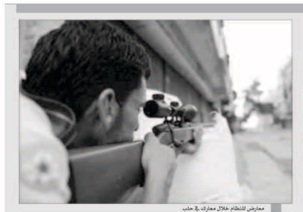
معارض للنظام خلال معارك في حلب

الأمم المتحدة - وكالات: اشكر الأمين العام للأمم المتحدة بان كي مون في تقريره أمس الأول إلى إنه عملية نقل أسلحة كيماوية من سوريا تأخرت دون ضرورة وعبر عن مخاوفه لحكومة الرئيس السوري بشار الأسد. ووافقت سوريا على تدمير ترسانتها من الأسلحة الكيماوية بموجب اتفاق تناقشت عليه روسيا والولايات المتحدة بعد هجوم بغاز السارين في 21 أغسطس قتل خلاله المئات ودفع واشتاقن لتهديد بنين هجمات جوية ضد سوريا. وتبادل الحكومة السورية والمتمردون الاتهامات بشن الهجوم. وقال بان في تقريره لمجلس الأمن التابع للأمم المتحدة بتاريخ 27 يناير لكنه أتيح يوم الثلاثاء إنه لم يتم الوفاء بمهلة 31 ديسمبر لإزالة المواد الكيماوية الأكثر خطورة. وتقول سوريا إن العملية تواجه تحديات أمنية.