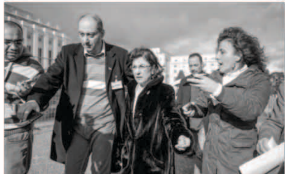
وفد النظام السوري في جنيف

مضيفاً أن المهم ألا يصل الغذاء إلى هؤلاء المحاصرين في حصص. وقال المفاد: «مازلنا ننتظر ضمانات لعدم وصول هذه الفواقل إلى مجموعات إرهابية مسلحة.. إلى جماعات إرهابية داخل المدينة. نريد أن نذهب إلى النساء والأطفال. مازلنا ننتظر هذه الضمانات». هذا وأسس مصرى قافلة إغاثة أعدتها الأمم المتحدة لآلاف السوريين المحاصرين في مدينة حمص في مهب الريح. أمس الأول. بعد أن قالت الحكومة إنها تريد ضمانات لعدم وقوع الإمدادات الغذائية والوقود إلى المدينة اختباراً لما إذا كانت محادثات السلام الجارية في سويسرا يمكن أن تحقق نتائج عملية على أرض الواقع. وقالت الأمم المتحدة إنها مستعدة لتوزيع مساعدات تكفي لمدة شهر على 2500 شخص محاصرين في المدينة التي تحولت إلى أنقاض بفعل الغصف والقتال على مدى أشهر. من جهته، أعلن المبعوث الدولي لخضر الإبراهيمي، في إفادة صحافية، أن «الغفلة جاهرة وما زالت تنتظر الدخول. لم تحصل بعد على تصريح للدخول ولم نقفد الأمل في صدوره».