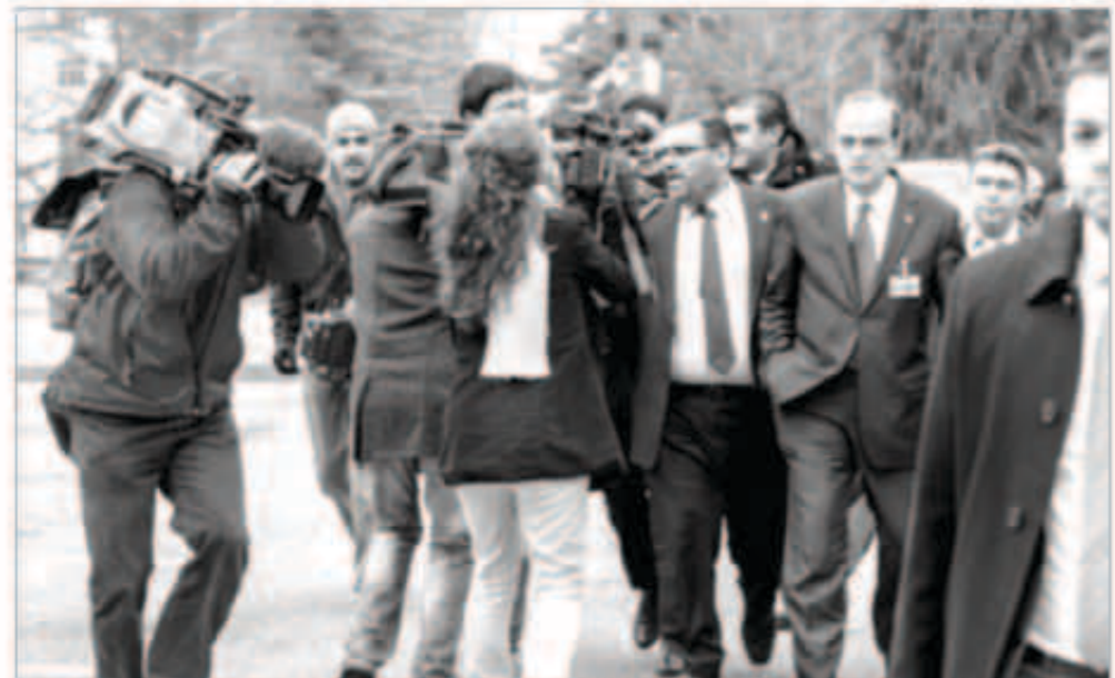
وفد المعارضة السورية في طريقه لقاعة الاجتماعات