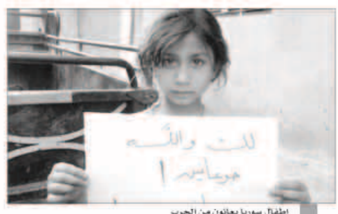
اطفال سوريا يعانون من الحرب

لندن - وكالات: قال نيك كليج نائب رئيس الوزراء البريطاني يوم الثلاثاء أن بريطانيا ستستقبل مئات من اللاجئين السوريين الأكثر معاناة مثل ضحايا الاغتصاب والتعذيب معنا ذلك تخفيفاً لموقف الحكومة. وقال كليج إن الحكومة ابطلت الأمم المتحدة أنها ستقبل لاجئين سوريين على أساس كل حالة على حدة لكنها لم تصل الي حد الموافقة على استقبال حصص من اللاجئين بمقتضى مشروع للمنظمة الدولية لإعادة توطين 30 ألف من الحالات الأكثر حاجة للمساعدة. وقال كليج «بما بيعت على الحزن أننا لا يمكننا تقديم الامان لكل من يحتاج اليه لكننا يمكننا ان نعد ادينا لبعض اولئك الذين هم في اشد الحاجة اليه». وقال كليج ان 130 ألف شخص في الحرب الأهلية التي تعصف بسوريا منذ ثلاث سنوات والتي أجبرت أيضا حوالي 2.4 مليون