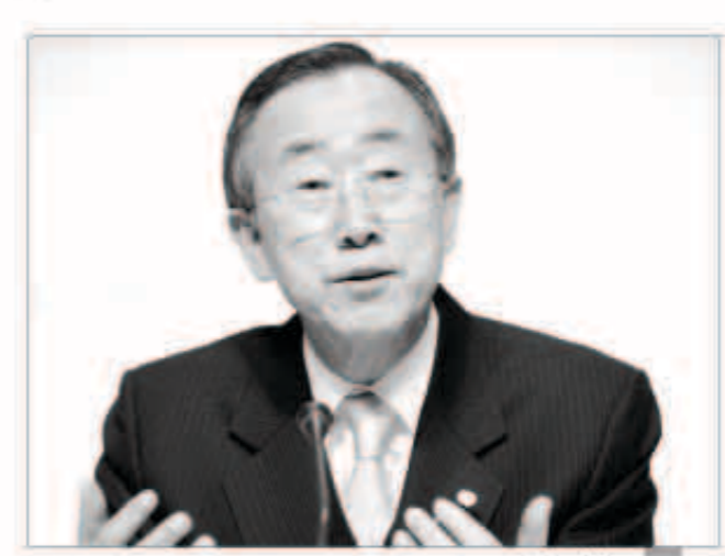
بان كي مون

عواصم - وكالات: اكتملت المفاوضات بين وفدي المعارضة والنظام السوريين في جنيف يومها السادس دون أن تحرز تقدماً يذكر، أو تظهر على جلساتها بوادر انفراجة مع إصرار كل طرف على موقفه في تفسير مقررات جنيف1. وأدت الخلافات الحادة بين الجانبين وتبادل الاتهامات بإفشال مفاوضات جنيف2، أمس الأول إلى إلغاء الجلسة المسائية، في وقت عبر مبعوث الأمم المتحدة والجامعة العربية المشترك الأخضر الإبراهيمي عن أمه بأن تكون الجلسات القادمة أفضل من سابقتها. واعترفت المعارضة السورية في بيان لها أمس الأول أنها نجحت في طرح ورقة هيئة الحكم الانتقالي السياسي على طاولة جلسة المفاوضات في مواجهة وفد النظام. وقال بيان وفد المعارضة «لا يمكن الحسم بأن مؤتمر جنيف 2 يتجه إلى الفشل رغم ضبابية المشهد». من جانبه قال الإبراهيمي في مؤتمر صحفي جنيف أمس الأول إن المفاوضات «لم تكن سهلة اليوم ولم تكن سهلة في الأيام الماضية ولن تكون سهلة في الأيام القادمة». وسعيداً عن سعاده بيان مهتل الطرفین أكدوا أنهم يتوون البقاء