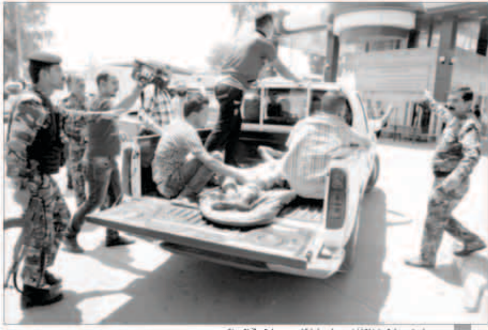
مسعفون يحاولون انقاذ احد ضحايا تفجير سابق في العراق

بغداد - وكالات: لقي 35 شخصاً على الأقل مصرعهم وجرح أكثر من مائة امس في تفجيرات بسيارات مفخخة في العاصمة العراقية بغداد وهجمات باحزمة ناسفة، واغادت مصادر أمنية وطبية بان الهجمات التي وقعت جنوبي العاصمة وشمالها استهدفت احياء شعبية. وقالت المصادر إن الكاظمية -شمال غرب العاصمة بغداد- عرفت وقوع أسوأ هجوم. أسفر عن مقتل خمسة أشخاص وإصابة نحو ثلاثين في عدة تفجيرات.