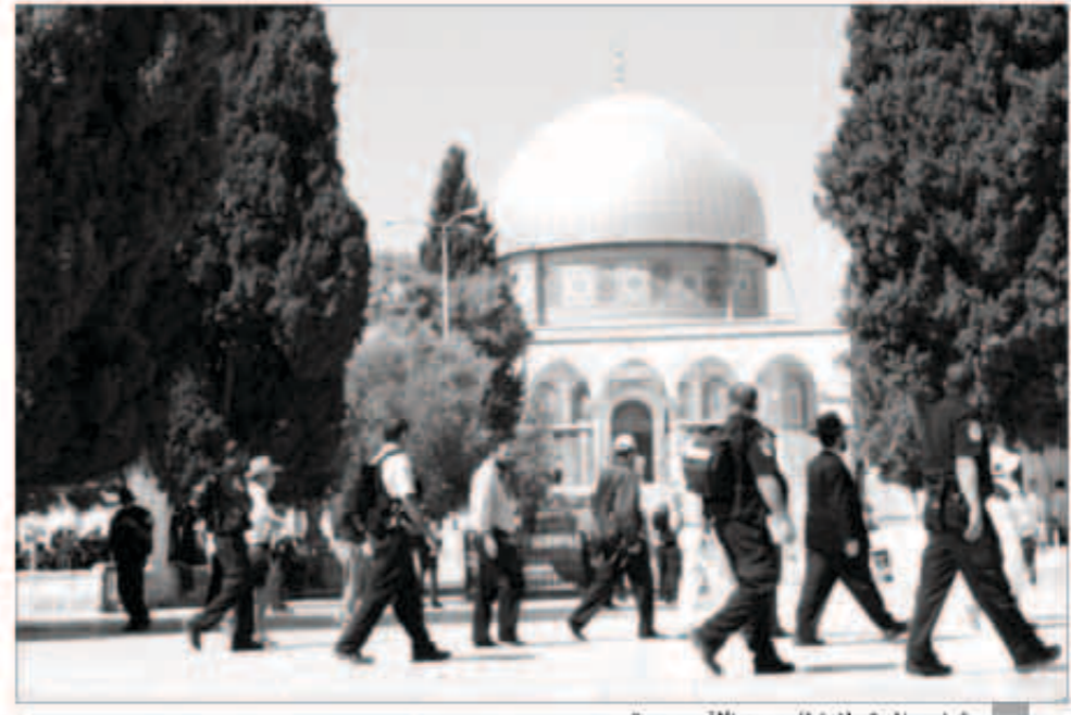
تندس المستوطنين للمسجد الأقصى مستمر

خلالها سبل التعاون بين منظمة التعاون الإسلامي و فلسطين و إيجاد البات دائمة للتنسيق بين الجانبين حول قضايا مشتركة تهدف إلى دعم القضية الفلسطينية وخاصة القدس الشريف. وأكد أمين عام المنظمة في الجلسة ضرورة الانتقال إلى خطوات عملية يمكن تطبيقها لتوفير الدعم لسكان مدينة القدس. واتفق الجانبان على آخر جلسة المباحثات على خطوات عملية يمكن اتخاذها في المستقبل للاستفادة من قرارات المنظمة ونقلها