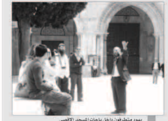
يهود متطرفون داخل باحات المسجد الأقصى

الأراضي المحتلة - «وكالات»: اقتحم عدد من المتطرفين اليهود أمس المسجد الأقصى وأدوا طقوساً دينية في باحات المسجد. وقال شهود عيان في تصريحات لوسائل الإعلام المحلية إن المتطرفين اليهود وتحت حماية مشددة من جيش الاحتلال الإسرائيلي اقتحموا باحات المسجد الأقصى وأدوا طقوساً تلمودية وهم يرفعون العلم الإسرائيلي.