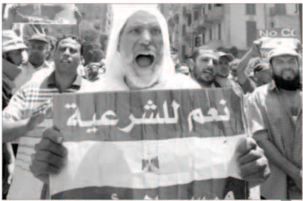
جانب من تظاهرات سابقة لانصار الإخوان