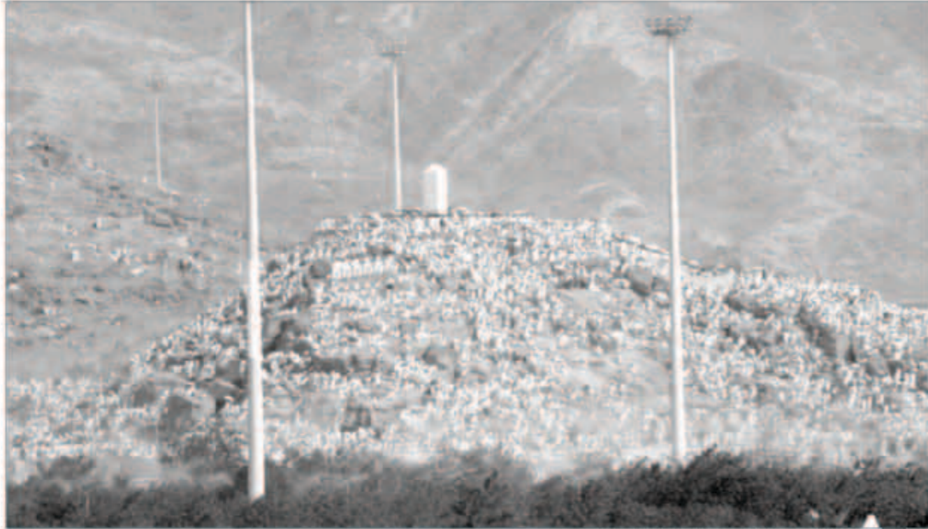
1.5 مليون حاج وقفوا على صعيد عرفات الطاهر أمس