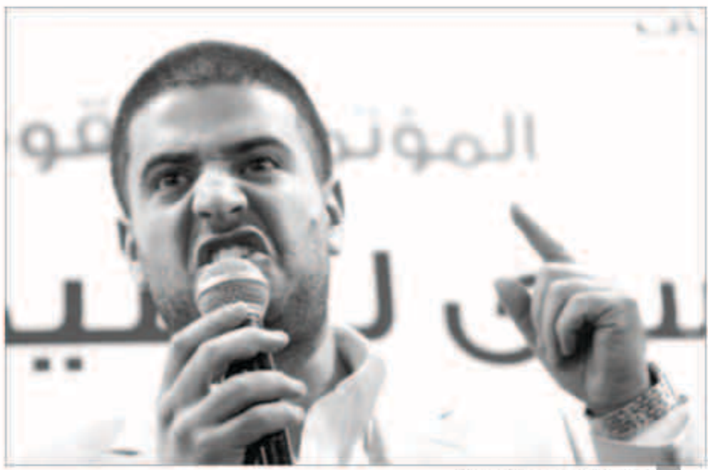
نجل محمد مرسي خلال لقاء سابق

أبو المجد ينتقد التناقض الواضح في موقف «الإخوان» من مبادرته