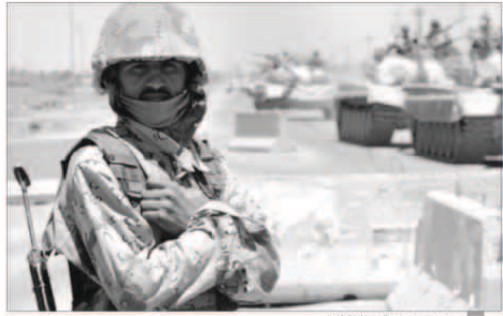
جنود من الجيش في محافظة الأنبار