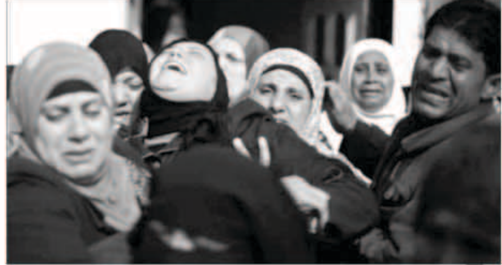
أهالي الشهيد الزعماني عقب استشهاد أسس