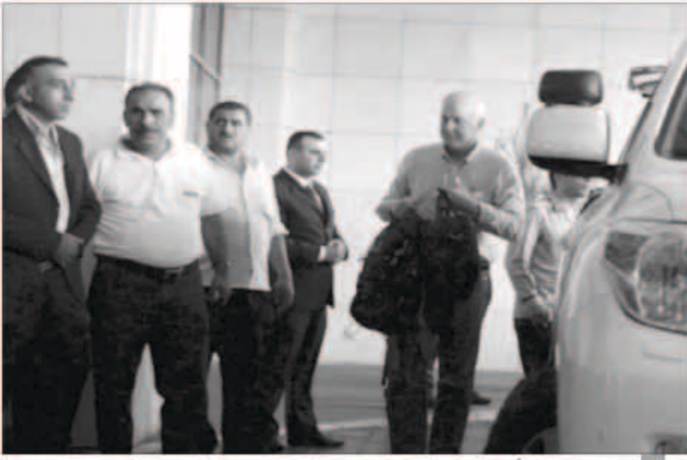
رئيس فريق خبراء الأمم المتحدة لدى وصوله دمشق

وكان ناشطون قد أكدوا أن مقاتلي المعارضة السورية أسقطوا الأحد طائرة حربية معارك اللاذقية، حيث تجري معارك ضارية بين فصائل مقاتلة والقوات النظامية السورية. كما سجلت اشتباكات في مناطق متفرقة، شملت اشتباكات بين المعارضة ومسلحين من الأكراد، بينما قتل عشرات المدنيين في قصف جوي ومدفعي بحلب وريف دمشق وغيرهما.