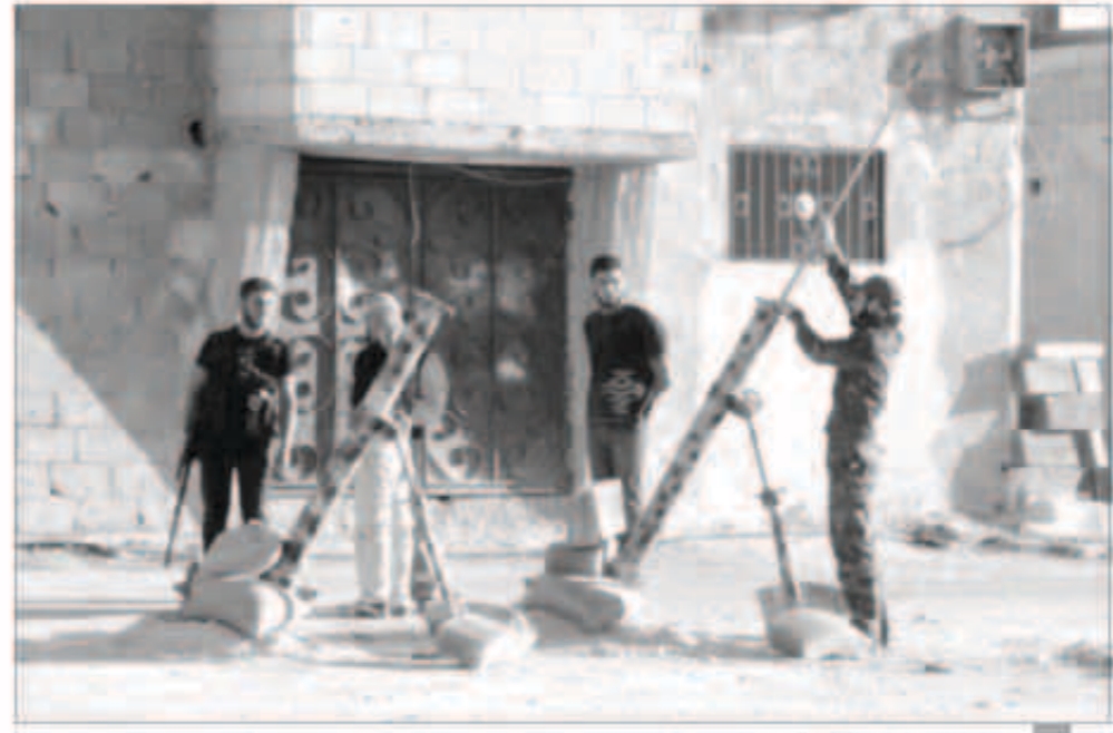
معارضون خلال معارك في حمص

دمشق - وكالات: بدأ فريق من خبراء الأسلحة الكيماوية التابع للأمم المتحدة عمله أمس للتحقيق فيما إذا كانت أسلحة كيماوية قد استخدمت في الصراع السوري. وطالبت المعارضة السورية المجتمع الدولي بضرورة تفتيش جميع المواقع التي يشتبه في استخدام النظام السوري للأسلحة الكيماوية فيها ومن ضمنها المناطق الحررة التي تقع تحت سيطرة المعارضة.