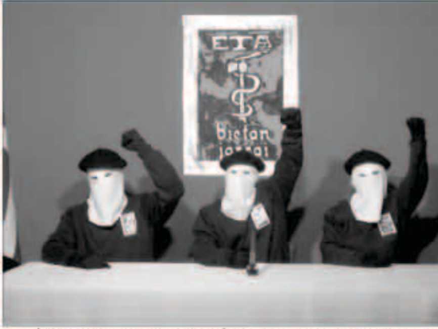
قائد من حركة أيتا الانفصالية خلال مؤتمره الصحفي الأخير. وفي الأضواء يدين بسخطه في اقتراح الأمم

الديمقراطية الحق في التكم بلغتهم بحرية بعد أن كان ذلك محظوراً خلال دكتاتورية الجنرال فرانكو 1939-1975.