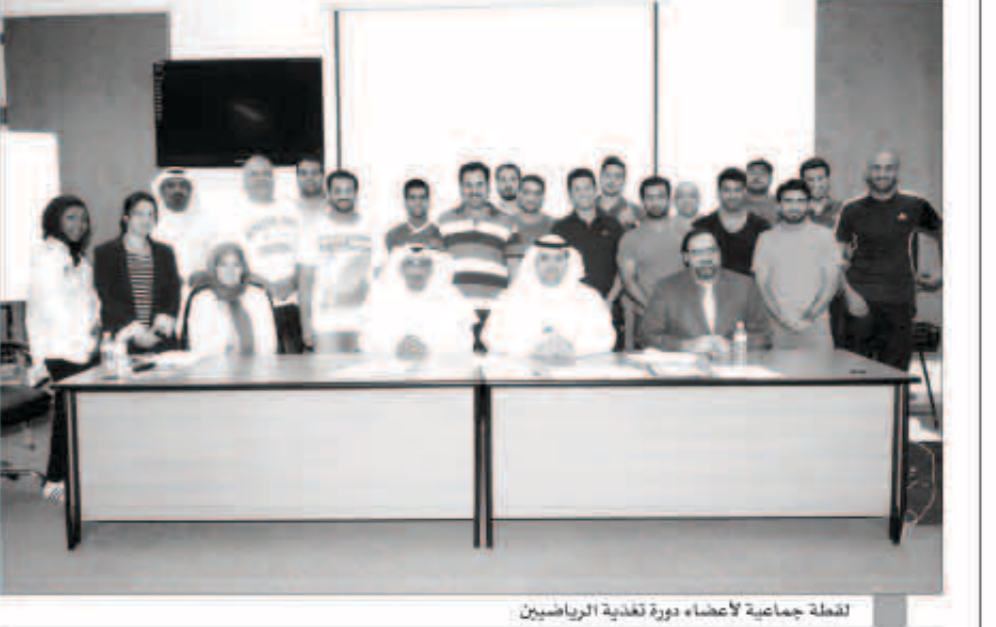
لقطة جماعية لأعضاء دورة تغذية الرياضيين