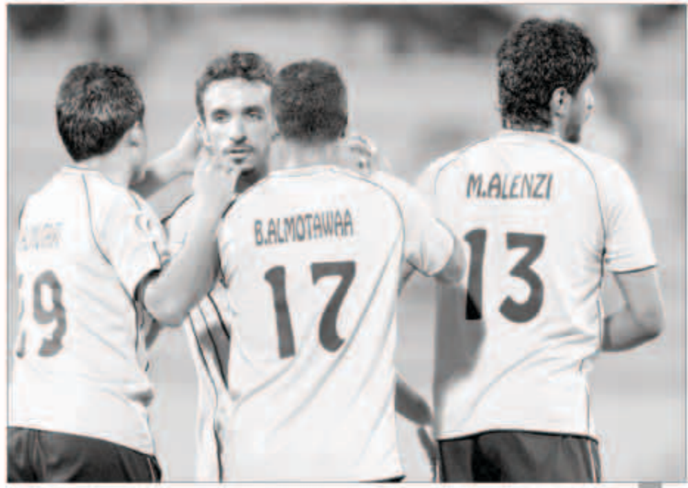
الملكى جاهز لمواجهة الرمثا

يستضيف الفريق الأول لكرة القدم بنادي القادسية نظيرة الرمثا الأردني اليوم على استاد محمد الحمد في الساعة الثالثة والنصف ظهرا في ختام لقاءات المجموعة الرابعة لبطولة كأس الاتحاد الآسيوي ويحتل الاصفر الصدارة برصيد 12 نقطة في حين أن الرمثا الأردني في المركز الثاني برصيد 9 نقاط ومن المقرر أن يلتقي الفريقين الآخرين بالمجموعة بنفس التوقيت حيث يحل الشرطة السوري ضيفا على رافشان الطايجستاني. ويخوض القادسية اللقاء بروح معنوية مرتفعة حيث يمر الفريق بحالة من الاستقرار الفني والنقسي وقاد من فوز كبير في كأس سمو الأمير بالفوز على اليرموك بخمسة. وسيق أن فاز القادسية في الجولة السابقة بالمجموعة على الشرطة السوري بهدفين نظيفين رد به اعتباره واستعداد من خلاله الثقة في أداء لاعبيه لمواصلة الانتصار في البطولة حتى بلوغ المباراة النهائية للظفر باللعب ليكون خبير تعويض عن فقدان للقب الدوري الممتاز الذي ذهب لقلبه للكويت والفوز اليوم أو التعادل يؤهله إلى دور