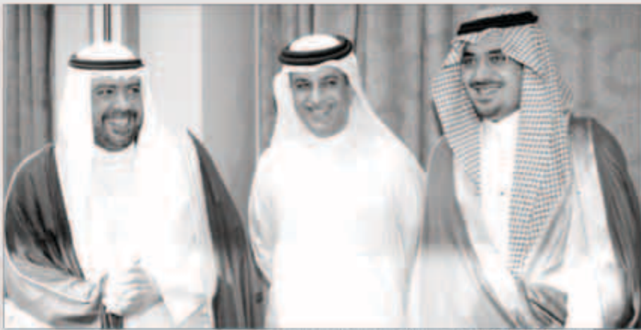
الشيخ أحمد الفهد مع نواف بن فيصل وسلمان بن ابراهيم

غادر امس الشيخ أحمد الفهد رئيس المجلس الأولمبي الآسيوي ورئيس اللجنة الأولمبية الكويتية متوجها إلى لاوس في زيارة تستغرق يومين قبل أن يتوجه إلى العاصمة الماليزية كوالالمبور مباشرة لحضور انتخابات رئاسة الاتحاد الآسيوي المقرر اقامتها 2 مايو المقبل. وتعد «لاوس» آخر محطات الفهد في جولته الآسيوية قبل الانتخابات لدعم المرشح البحريني الشيخ سلمان بن ابراهيم منصب رئاسة اتحاد الكرة الآسيوي. وفي سياق متصل، غادر ايضا سماء امس الشيخ طلال الفهد رئيس اتحاد كرة القدم متوجها إلى تايلاند لبطعة ساعات قبل السفر لكوالالمبور لحضور اجتماع الجمعية العمومية للاتحاد الآسيوي وحضور انتخابات رئاسة الاتحاد وعضوية المكتب