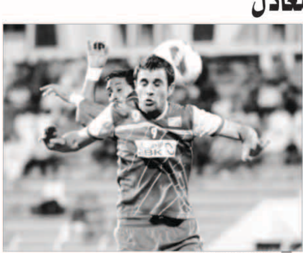
جانب من لقاء العربي والفحيحيل