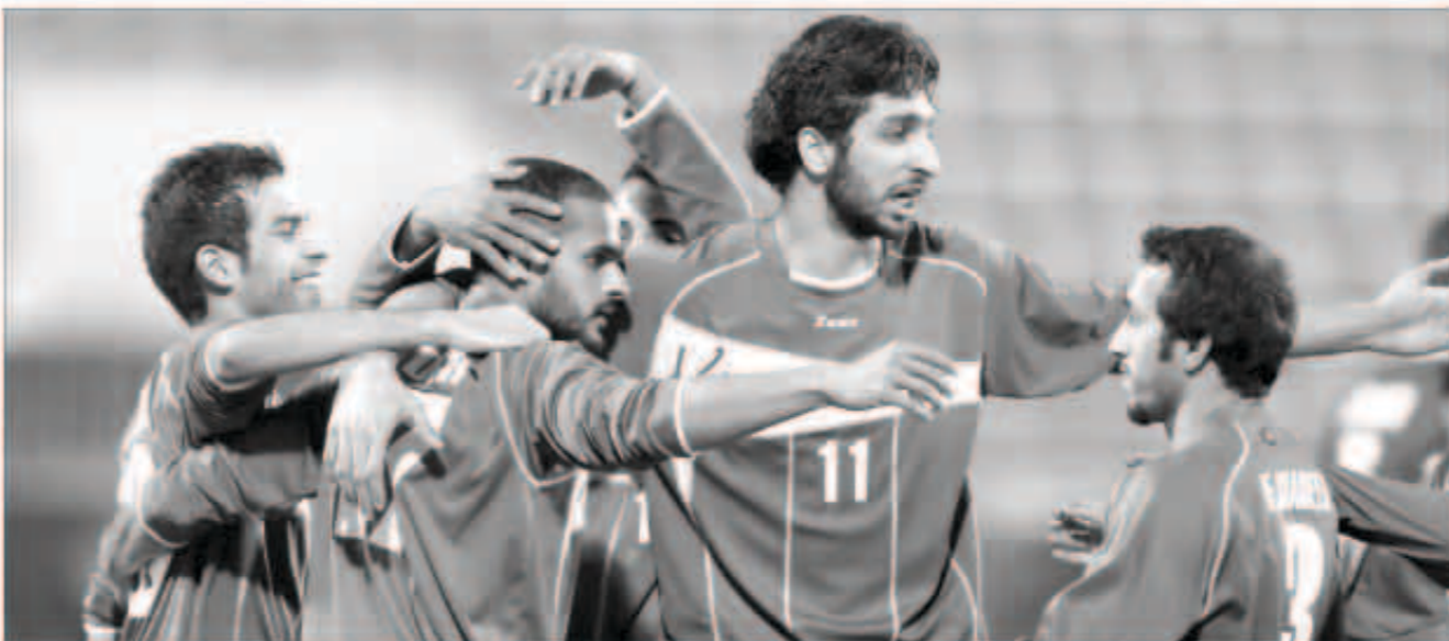
الأزرق سيعلم بالبحرين وديا