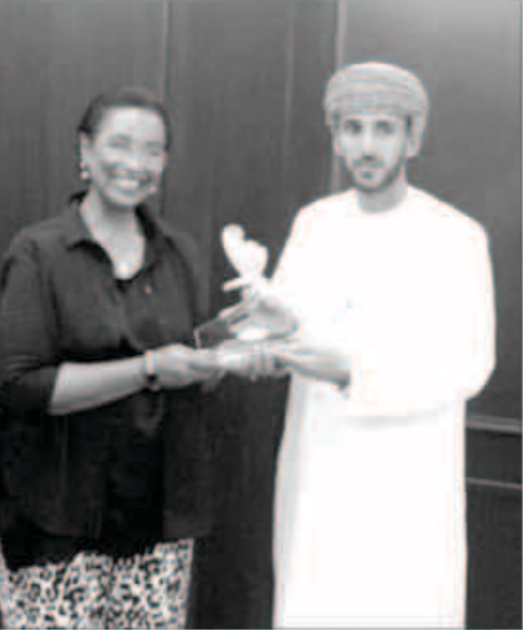
الشيخة نعيمة والحوسني خلال تبادل الدروع التذكارية

اعلنت رئيسة اللجنة التنفيذية لرياضة المرأة بدول مجلس التعاون الخليجي الشيخة نعيمة الاحمد الصباح استضافة دولة الكويت الشهر المقبل اول بطولة خليجية لكرة اليد النسائية. وقالت الشيخة نعيمة الاحمد على هامش اجتماعها مع رئيس اللجنة التنظيمية لدول مجلس التعاون لكرة اليد سلطان الحوسني ان البطولة التي ستعقد في الثالث من اكتوبر وتستمر حتى السابع منه ستضم منتخبات كل من عمان والإمارات وقطر والبحرين والكويت.