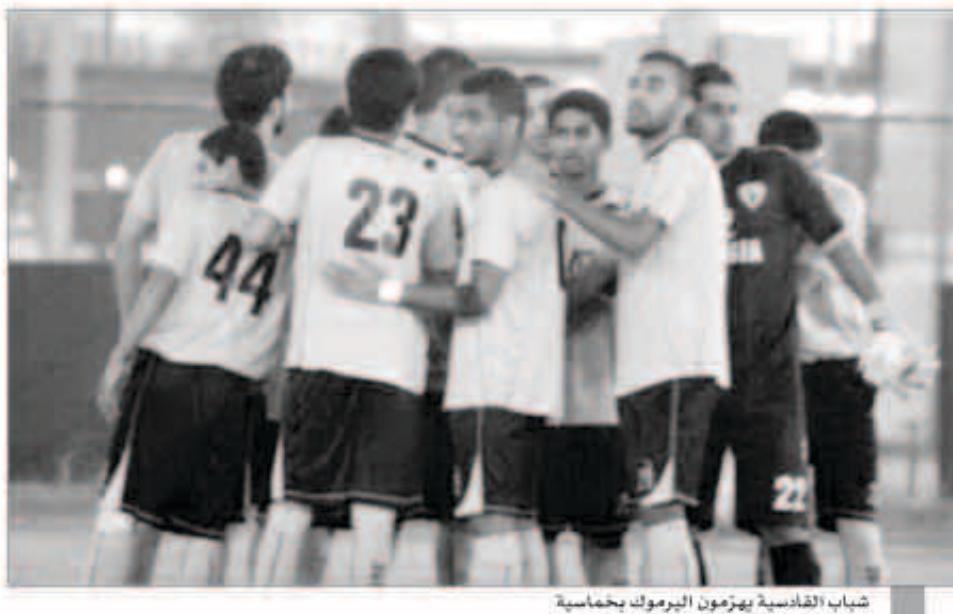
شباب القادسية يهزمون البرموك بحصامية

ويتنافس 13 فريق خلال الموسم الحالي على دوري الشباب لكرة القدم بعد انسحاب فريق الشباب حيث قررت إدارة نادي الشباب الانسحاب من دوري تحت 20 نافية بنتها الانسحاب من دوري الريدف.