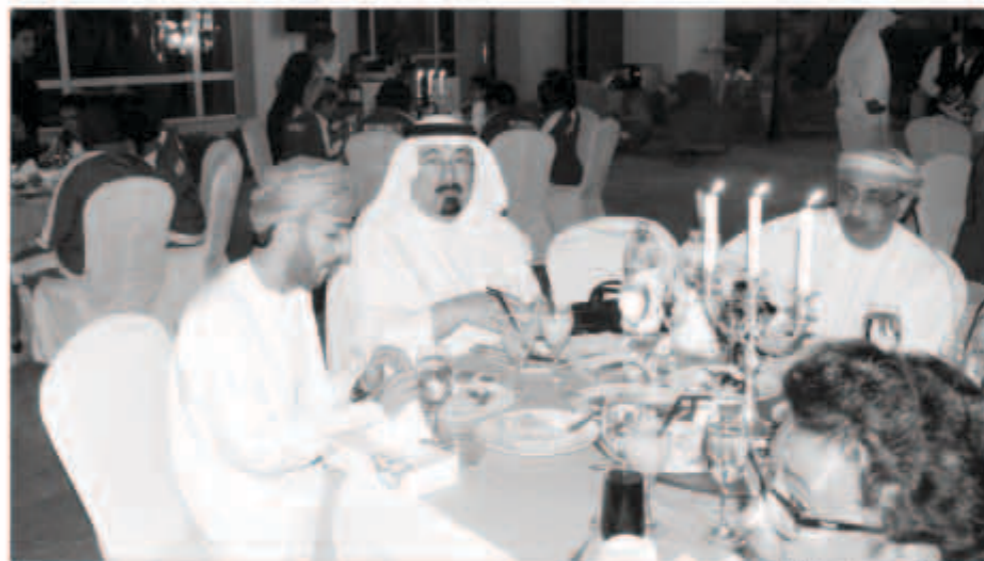
من حفل الافتتاح

انطلقت بطولة الخليج الأولى لكرة اليد للسيدات مساء أول من أمس في فندق الريجنسي في حفل مهير حضرته رئيسة اللجنة المنظمة العليا للبطولة الشيخة نعيمة الأحمد الصباح ورؤساء وأعضاء الوفود المشاركة وحشد كبير من محبي وعشاق كرة اليد، ورحبت الشيخة نعيمة الأحمد في كلمة مبسطة بالوفود المشاركة في أول تجمع لسيدات الخليج يلعبه اليد في بلدنهم الثاني الكويت منفتحة لهم طيب الإقامة بين أهلهم كما أعلنت انطلاق البطولة التي أقيم أمس أولى مساء بقاء سيدات الأزرق مع سيدات البحرين في السابعة مساء على صالة نادي سولي الرياضي بسيفه لقاء في الخامسة مساء بين سيدات قطر وعمان.