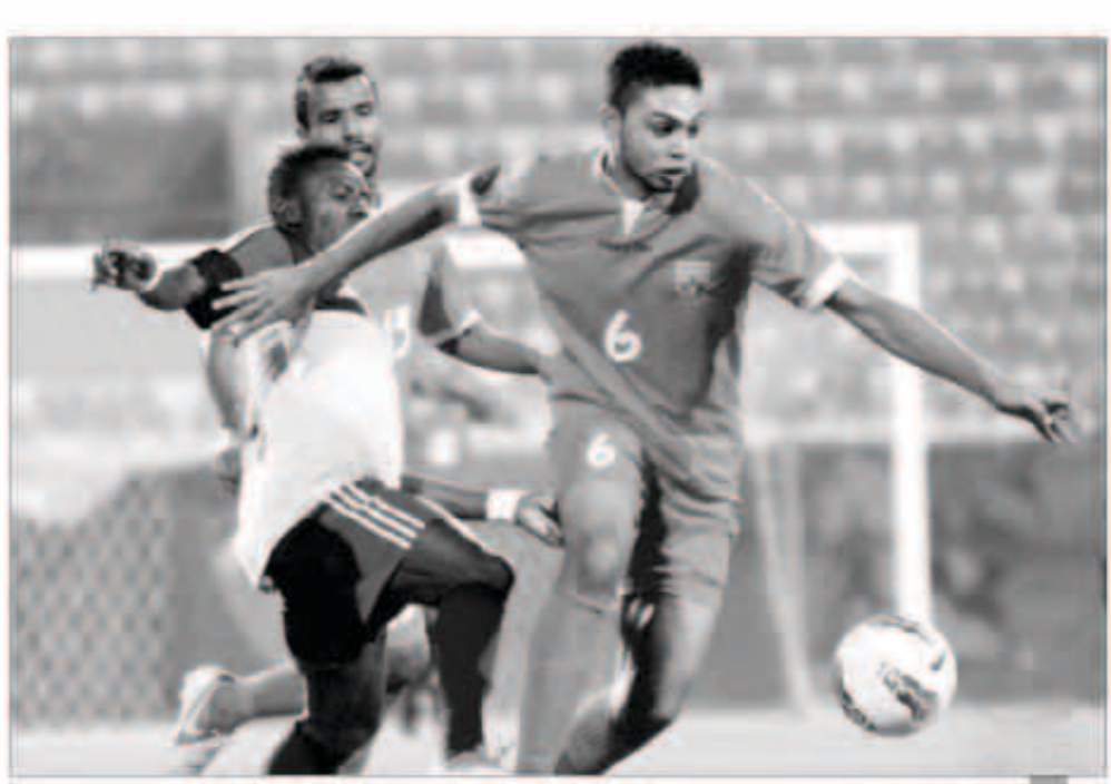
كاظمة في لقاء سابق