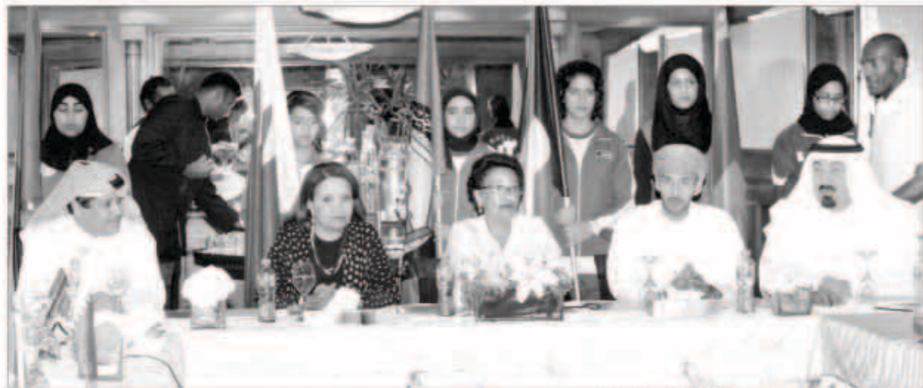
الشيخة نعيمة وضيوف البطولة خلال حفل الافتتاح