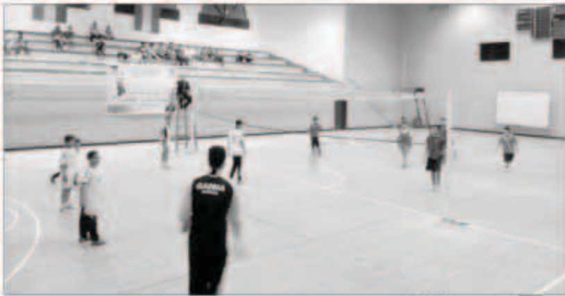
جانب من الأنشطة