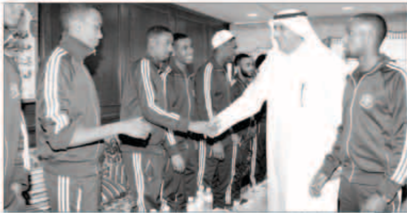
الجفاف مستقبلاً منتخب الصومالي