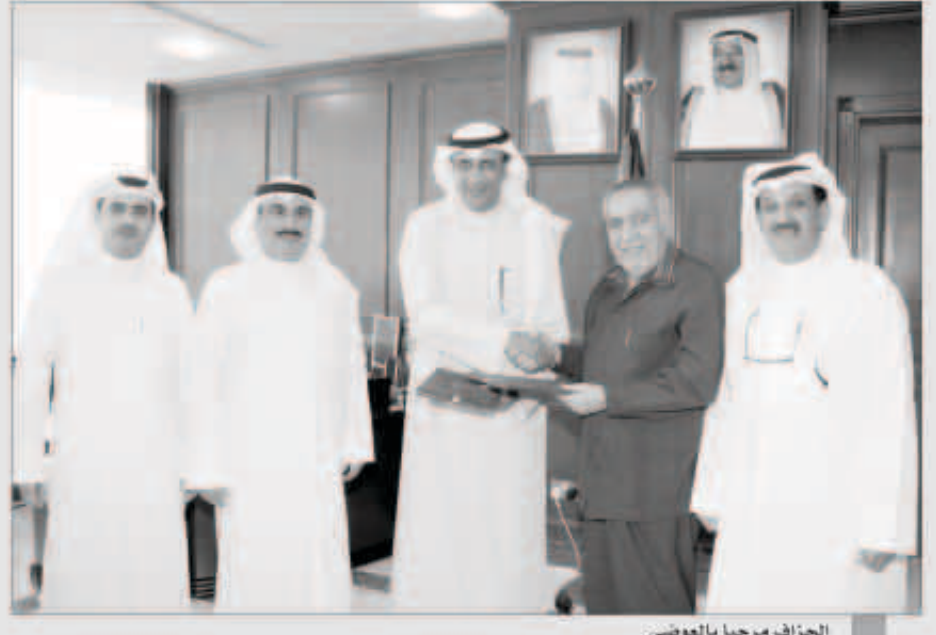
الجزاف مرحبا بالعوضي

أكد اللواء م. فيصل الجزاف رئيس مجلس الإدارة والمدير العام للهيئة العامة للشباب والرياضة، على أهمية تضافر جهود كافة الجهات الأهلية والحكومية في خدمة شباب الكويت من أجل تنفيذ الإستراتيجية المعدة لارتقاء بواقعهم بما يحقق التطلعات والتوجهات السامية لخضرة صاحب السمو أمير البلاد المفدى، لإسيما وأن الشباب يمثلون الشريحة الكبرى في المجتمع.