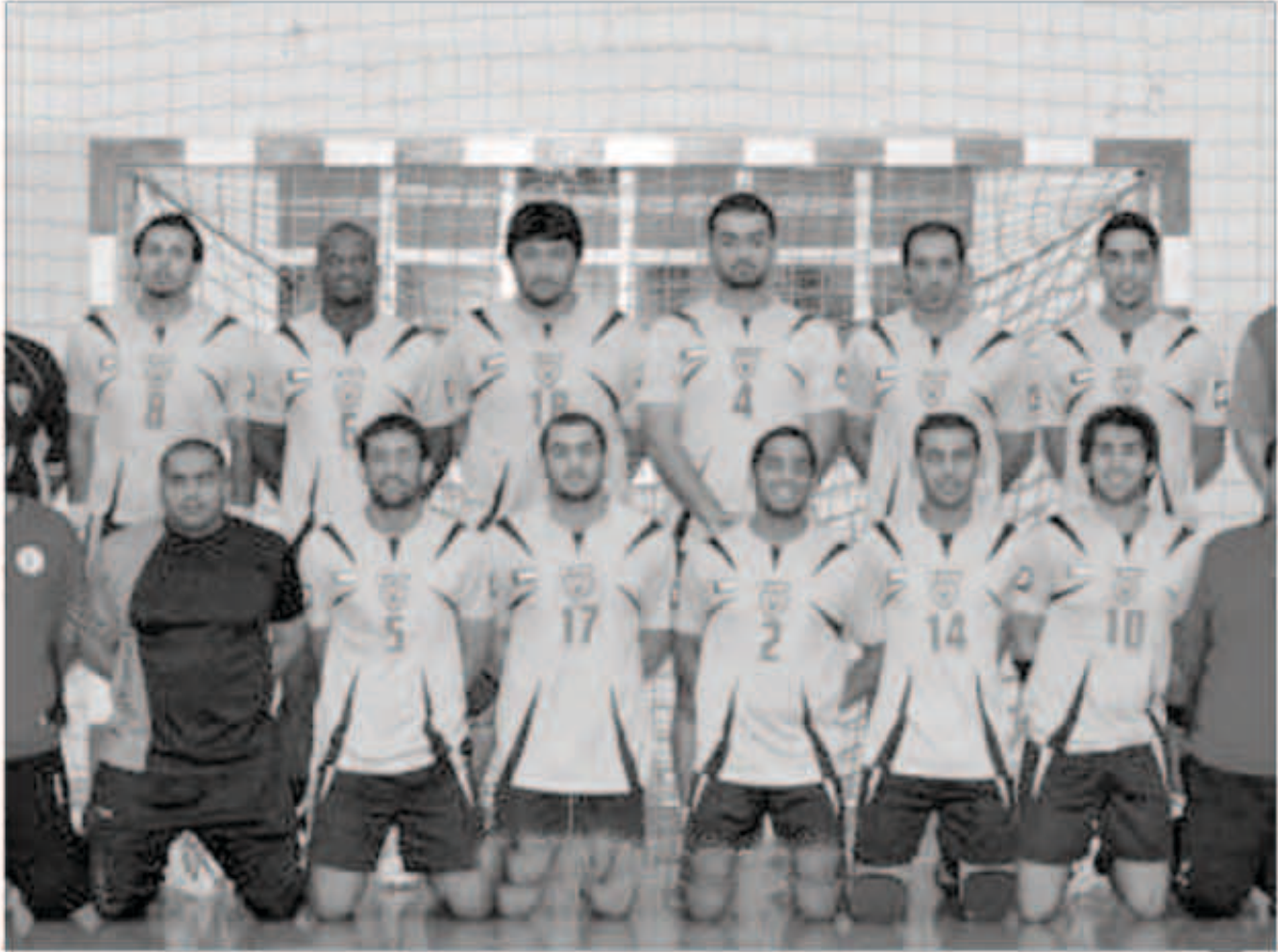
فريق القادسية لكرة اليد

يلتقي اليوم فريق القادسية لكرة اليد ونظيره يوشاك طشقند الأوزبكي ضمن الجولة الخامسة من المجموعة الثالثة من البطولة الآسيوية السادسة عشرة للأندية أبطال الدوري لكرة اليد والتي تستضيفها قطر كما تقام في نفس المجموعة مباراة الأهلي السعودي والأهلي الإماراتي. وكان قد تاهل الجيش القطري إلى الدور الثاني، وذلك بعد فوزه على الكرخ العراقي بنتيجة 27 / 16 في المباراة التي أقيمت على صالة الغرافة. وبهذا الفوز رفع الجيش رصيده إلى أربع نقاط حسب ما صادرة المجموعة الأولى لصالحه على أن تبقى البطاقة الثانية بين الجزيرة الإماراتي والكرخ العراقي بانتظار مباراتهما في ختام الدور الأول. وقد حسم الجيش الفوز منذ الشوط الأول الذي فرض فيه تفوقه وأنهاه لصالحه 14 / 5 مما جعله يلعب بأقل مجهود في الشوط الثاني الذي منح فيه المدرب الفرصة للبدلاء وهو ما ساعد الكرخ على مجاراته. كما تقام مباراتين في المجموعة الرابعة اليوم أيضا حيث يلتقي لخويا القطري والسد اللبنياني فيما يواجه الأهلي البحريني فريق ثامن الحجج الإيراني.