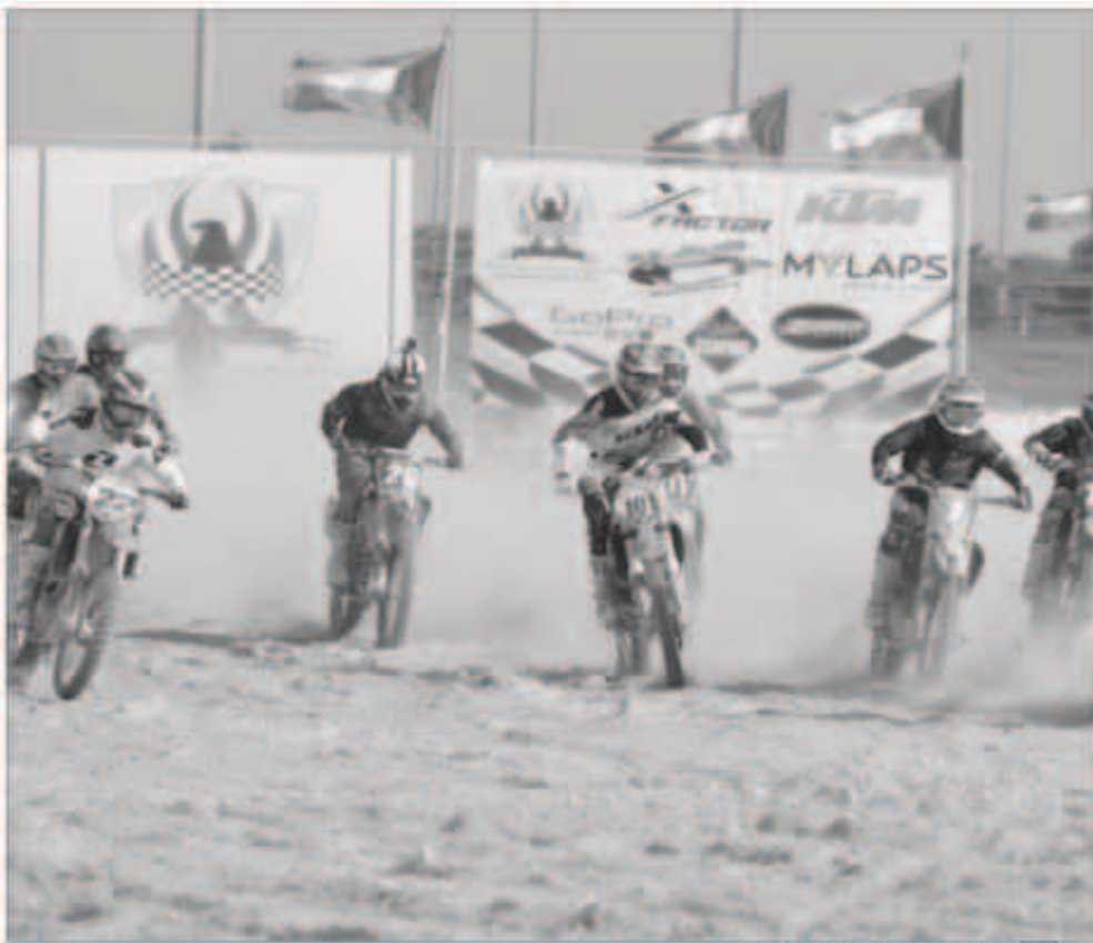
جانب من منافسات البطولة

اقامت أمس الأول الجولة الثانية من بطولة الكويت الدولية للموتوكروس والتي نظّمها النادي الكويتي لرياضة السيارات والدراجات الآلية على حلبة الشيخ جابر الاحمد وذلك بحضور رئيس النادي الشيخ احمد الداود الصباح ووفد من دولة الامارات الشقيقة وتم افتتاح البطولة بمشاركة العديد من فئات الدراجات الثارية وهي دراجات الموتوكروس ودراجات ال آ تي في