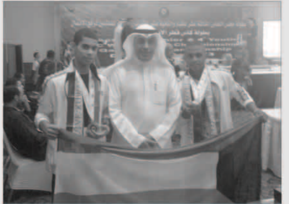
فليطح يكرم الخريجين

أكد الدكتور حمود فليطح نائب المدير العام لشؤون الشباب بالهيئة العامة للشباب والرياضة حرص الهيئة على دعم الطاقات الشبابية المبدعة في كافة المجالات واستثمار أوقات فراغهم فيما يعود عليهم بالنفع والفائدة وخاصة في مجال الفن والمسرح لأهميته في بناء شخصية الشباب وتوعية المجتمع.