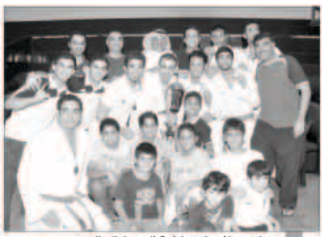
عماد بيهباني يتوسط فرق اليرموك والبطول

توج نادي اليرموك بطلا لبطولة اتحاد الكراتيه الاولى للفرق العمومي بعد جمع 19 نقطة جعلته في المركز الأول ويلحقه بمرکز الثاني الذي جمع 15 نقطة وبالقاسية بالتساوي بها 11 نقطة وشارك في البطولة 215 لاعب يمثلون 13 نادياً. وتمكن اليرموك من تحقيق الفوز بلقب منافسات الكاتا فرق وجاء خلفه كل من القاسية نادياً ثم القاسية والسالية بالمرکز الثالث ولم يتكف اليرموك بلقب الكاتا فردي وجمع معه لقب القتال فرق ونال التضامن المركز الثاني بينما حقق كل من النصر والقاسية المركز الثالث. وبعد الحفام قام نائب رئيس الاتحاد الكراتيه عماد بيهباني بتسليم الجوائز للفرق الفائزة بحضور ممثل الفرق المشاركة. وقال عماد بيهباني إن اليرموك استحق نيل لقب البطولة بعد ان تآلق في جميع الأوزان وضعة في الصدارة دون منازع مشيراً إلى ان المنافسة كانت قوية حتى اليوم الختامي للبطولة ولم تعرف الفرق الفائزة إلا في اللحظات الأخيرة وهذا ما تعودنا عليه من أنديةنا الذين يعدون الفرق خير اعداد ليكونوا خير نواة لمستحقين.