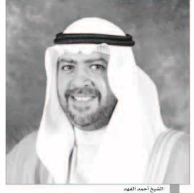
الشيخ أحمد الفهد

جرت في العاصمة القطرية الدوحة إعادة انتخاب الشيخ أحمد الفهد رئيساً للاتحاد الآسيوي لكرة اليد بالتركية خلال اجتماع الجمعية العمومية للاتحاد. وتمكن رئيس الاتحاد القطري لكرة اليد أحمد الشعبي من الفوز بمنصب نائب رئيس الاتحاد الآسيوي لكرة اليد بالتركية خلال الجمعية العمومية التي بدأت أعمالها بعد التأكد من اكتمال النصاب القانوني برئاسة الشيخ أحمد الفهد وحضور رئيس الاتحاد الدولي الدكتور حسن مصطفى. وتوجه الشيخ أحمد الفهد في الكلمة الافتتاحية بالشكر للحاضرين ولدولة قطر على هذه الاستضافة كما تطرق في حديثه إلى التطور الذي شهدته كرة اليد الآسيوية في السنوات الأخيرة وكذلك العدد الكبير من البطولات التي يتم تنظيمها تحت مظلة الاتحاد الآسيوي. وأكد أن «العمل على نفس النهج في المواسم القادمة» بصورة مثالية في السنوات السابقة ويجب أن تتم المواصلة على نفس النهج في المواسم القادمة» من جهته شكر حسن مصطفى رئيس الاتحاد الدولي، الاتحاد الآسيوي على دعواته لحضور اجتماع الجمعية وابتدئ إرتيابه للعمل الكبير المنجز على مستوى الفكرة الآسيوية بفضل الجهد الدائم للاتحاد اللعبة فارتيا ومجهودات الشيخ أحمد الفهد.