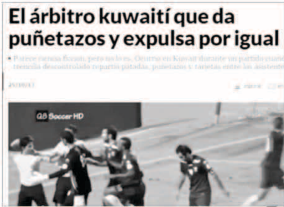
صحيفة ماركيا الإسبانية اهتمت بفضيحة الحكم الكويتي ووضعت فيديو للواقعة وهو يعرض على اللاعبين

■ محللون: المباراة هي الوحيدة التي نقلت على «اليوتيوب» وما يحدث بعيداً عن الأنظار مؤسف