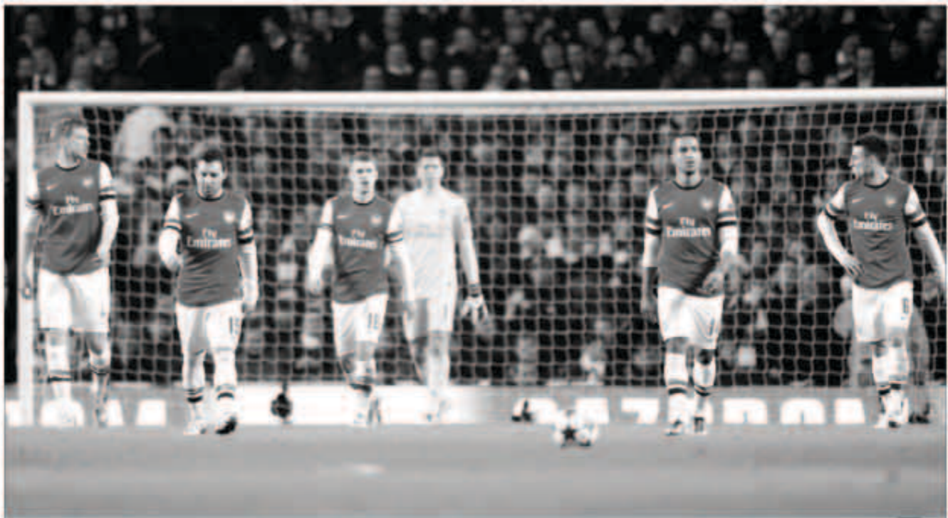
أرسنال يتحلى بالثقة في مواجهة شاربشة

قد يضفي شاختر كاراجاندي - وهو فريق قادم من مدينة تعدين في كازاخستان أقرب إلى منغوليا منها إلى مقر الاتحاد الأوروبي لكرة القدم في سويسرا - نكهة غريبة على دور المجموعات في دوري أبطال أوروبا إذا نجح في الصمود أمام سيلتيك غدا الأربعاء. وسيمثل الفريق القادم من كاراجاندي - وهي مدينة لمناجم الفحم - تقدمه 2- صفر إلى جلاسجو في آياب الدور الأخير من التصفيات حيث ستقام عشر مواجهات يومي اليوم وغدا لتحديد من سينضم إلى 22 فريقا ضمن التال لمرحلة المجموعات. وهناك الكثير من الناحية المالية إذ سيحصل كل فريق من الفرق 32 المشاركة في مرحلة المجموعات على مبلغ مبدئي قيمته 8.6 ملايين يورو 11.53 مليون قدم وفقا للاتحاد الأوروبي لكرة القدم بالإضافة إلى مليون يورو عن كل فوز ونصف مليون لكل تعادل. وستحصل الفرق على المزيد من الدخل من حقوق البث التلفزيوني للاتحاد الأوروبي لكرة القدم وغلوبال رعايا.