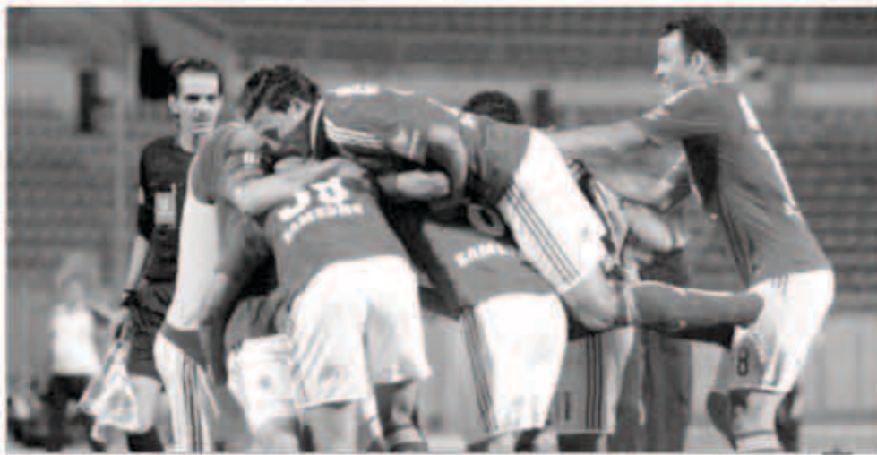
فرحة لاعبي الأهلي بالتعادل